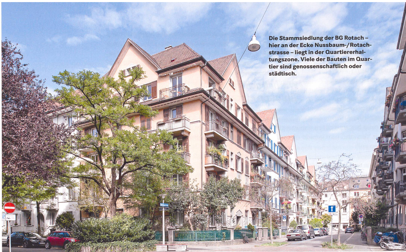
Die Stammsiedlung der BG Rotach – hier an der Ecke Nussbaum-/Rotachstrasse – liegt in der Quartiererhaltungszone. Viele der Bauten im Quartier sind genossenschaftlich oder städtisch.