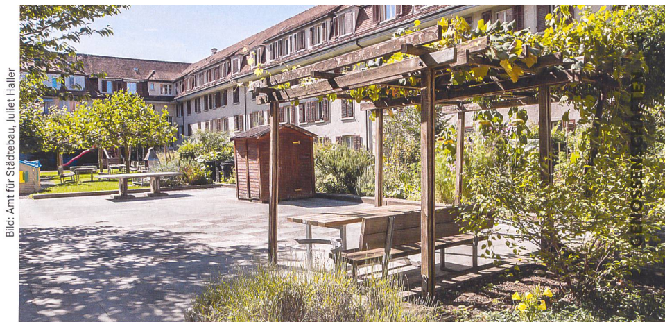
Die Innenhöfe im Rotachquartier sind unterschiedlich gestaltet, alle sind aber geschützt, begrünt und vielfältig nutzbar.

Die Arbeitsgruppe hat angesichts dieser kniffligen Ausgangslage bei der Strategieentwicklung für die Siedlung im Rotachquartier nach neuen Wegen gesucht. «Uns ging es darum, die Qualität des Bestehenden fassbar zu machen und zu überprüfen, welche Optionen zukunftsfähig sind. Was macht es aus, dass Wohnungen, die vor neunzig Jahren gebaut