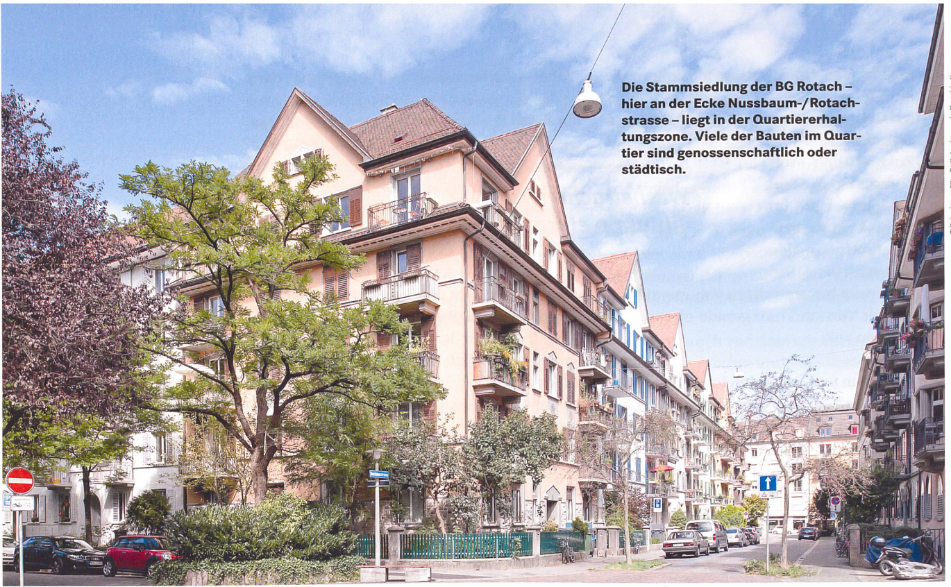
Die Stammsiedlung der BG Rotach – hier an der Ecke Nussbaum-/Rotachstrasse – liegt in der Quartiererhaltungszone. Viele der Bauten im Quartier sind genossenschaftlich oder städtisch.