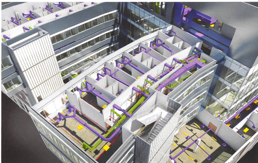
Erste BIM-Projekte in der Schweiz gab es bei Spitälern, da diese höchste Anforderungen an eine flexible Planung und einen effizienten späteren Betrieb stellen.

Informationswege, zudem liegen die Informationen in unterschiedlichen Formen vor, als E-Mail, Pläne, Hand- und elektronische Notizen usw. Es ist sehr anspruchsvoll, diese richtig zu sammeln, abzulegen und an alle zu kommunizieren. Man braucht einen wesentlichen Teil seiner Zeit dafür, Informationen zu sortieren und die Übersicht zu wahren.