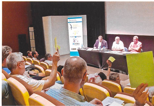
Armoup-GV in Genf.

Einen Meilenstein bildet der Abschluss des ersten Managementlehrgangs mit 27 erfolgreichen Teilnehmerinnen und Teilnehmern. Lobbying und Öffentlichkeitsarbeit sowie verschiedene Veranstaltungen rundeten das Geschäftsjahr ab.