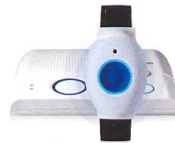
SmartLife Care Genius Der unkomplizierte Mitbewohner für massgeschneiderte Sicherheit