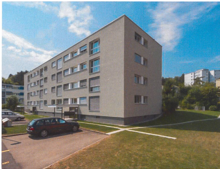
Gesamtsanierung MFH Am Brunnenbächli in Zollikon

Liegenschaftsanalysen Generalplanungen Bauleitungen