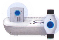
SmartLife Care Flex Das flexible Multitalent mit Zusatz- lautsprecher in der Ladestation

Mit Swisscom SmartLife Care ist Hilfe sofort zur Stelle, wenn Sie sie brauchen.