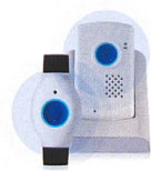
SmartLife Care Mini Der diskrete Begleiter für die Ta- sche mit integriertem GPS-Modul