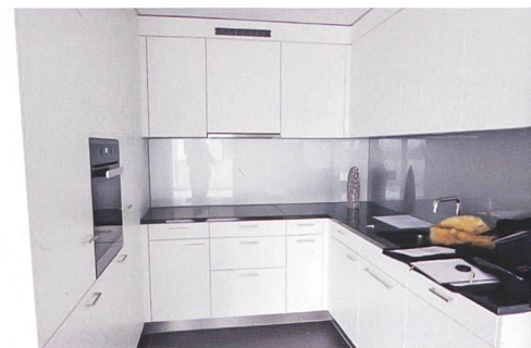
Die Wohnungen bieten gehobenen Komfort.