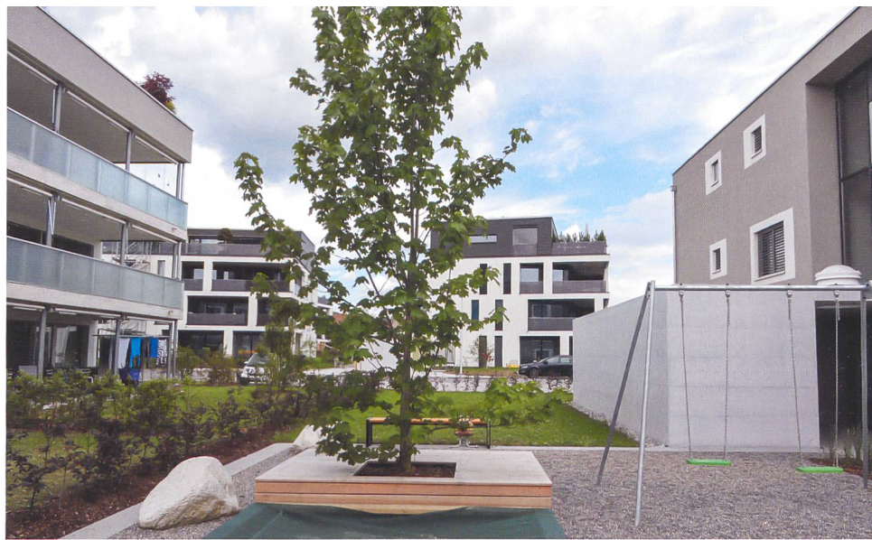
Im Aussenraum werden sich Alt und Jung begegnen, ist in einem der Häuser doch die Kinderkrippe YoYo untergebracht.

Die beiden Bauten umfassen 13 Wohnungen mit zweieinhalb bis viereinhalb Zimmern. Sie bestechen durch die grosszügigen privaten Aussenräume, die einen weiten Blick über grüne Wiesen und Hügelland erlauben. Die neuen Häuser liegen zwar am Dorfrand, doch die Bushaltestelle ist nur wenige Gehminuten entfernt. Die Wohnungen bieten hohen Komfort, bestand das Zielpublikum doch vor allem aus älteren Menschen, die eine praktische Alternative zum Einfamilienhaus suchten. Alle Einheiten sind durchgehend hindernisfrei eingerichtet, besitzen beispielsweise schwellenlose Duschen. Mit dem Anschluss an die nahe