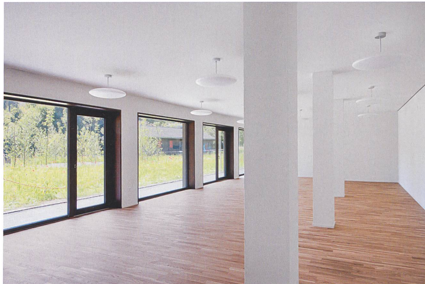
Der Gemeinschaftsraum wird inzwischen bereits rege genutzt.