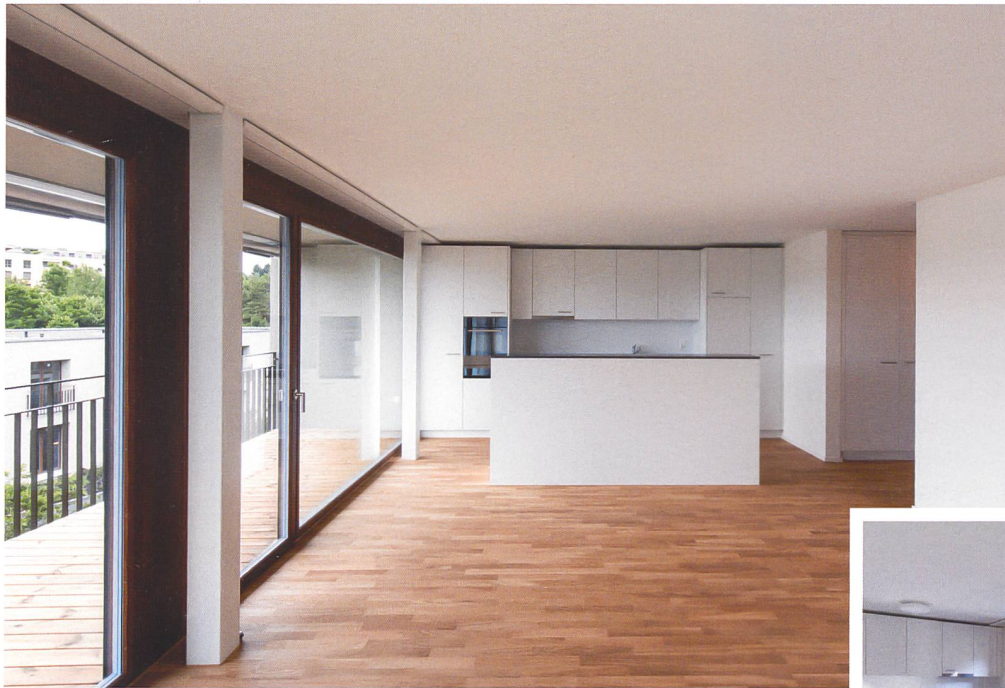
Die Wohnungen richten sich an den oberen Mittelstand.