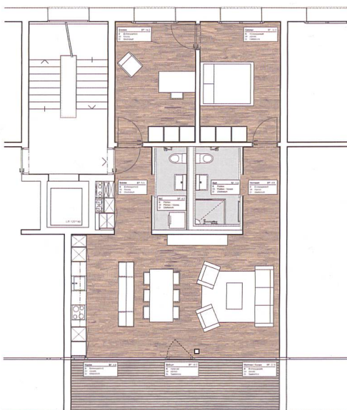
Grundriss einer 3 1/2-Zimmer-Wohnung mit rund 85 Quadratmetern Wohnfläche.