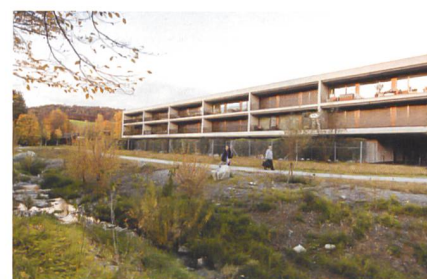
Ein renaturierter Bach führt an der Siedlung vorbei.

die Hürde sei, Eigentum aufzugeben und in eine Alterssiedlung zu ziehen. «Viele ältere Menschen wohnen sehr günstig in Bolligen, weil sie ihre Hypotheken abbezahlt haben», erklärt der Genossenschaftspräsident. «Die überlegen sich natürlich zweimal, ob sie wieder Miete bezahlen wollen.»