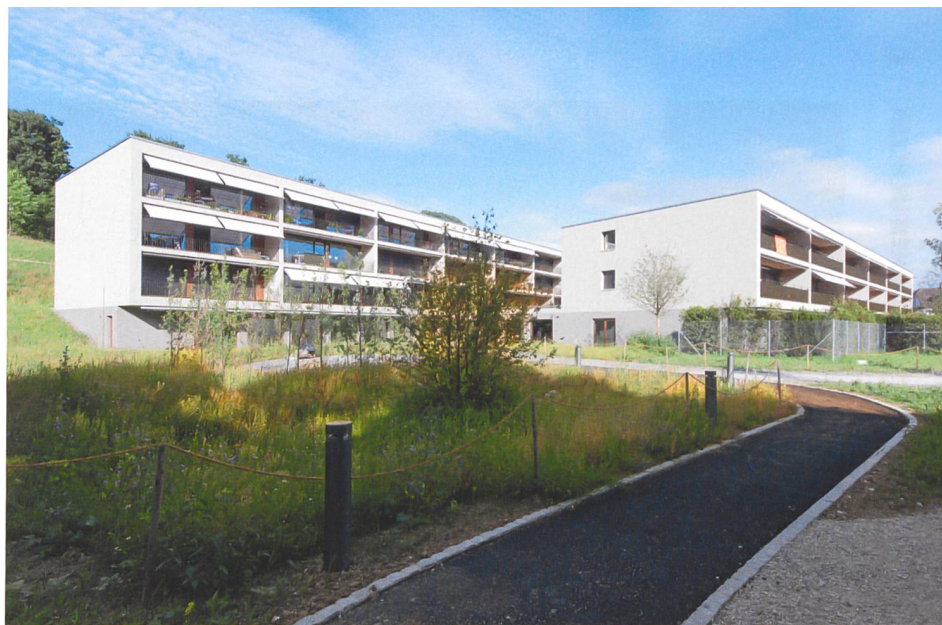
Dank der leichten Hanglage erhalten alle Wohnungen viel Tageslicht.