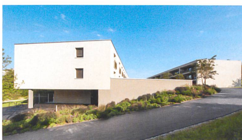
Die Bauten stehen auf einem Betonsockel, der sie verbindet.