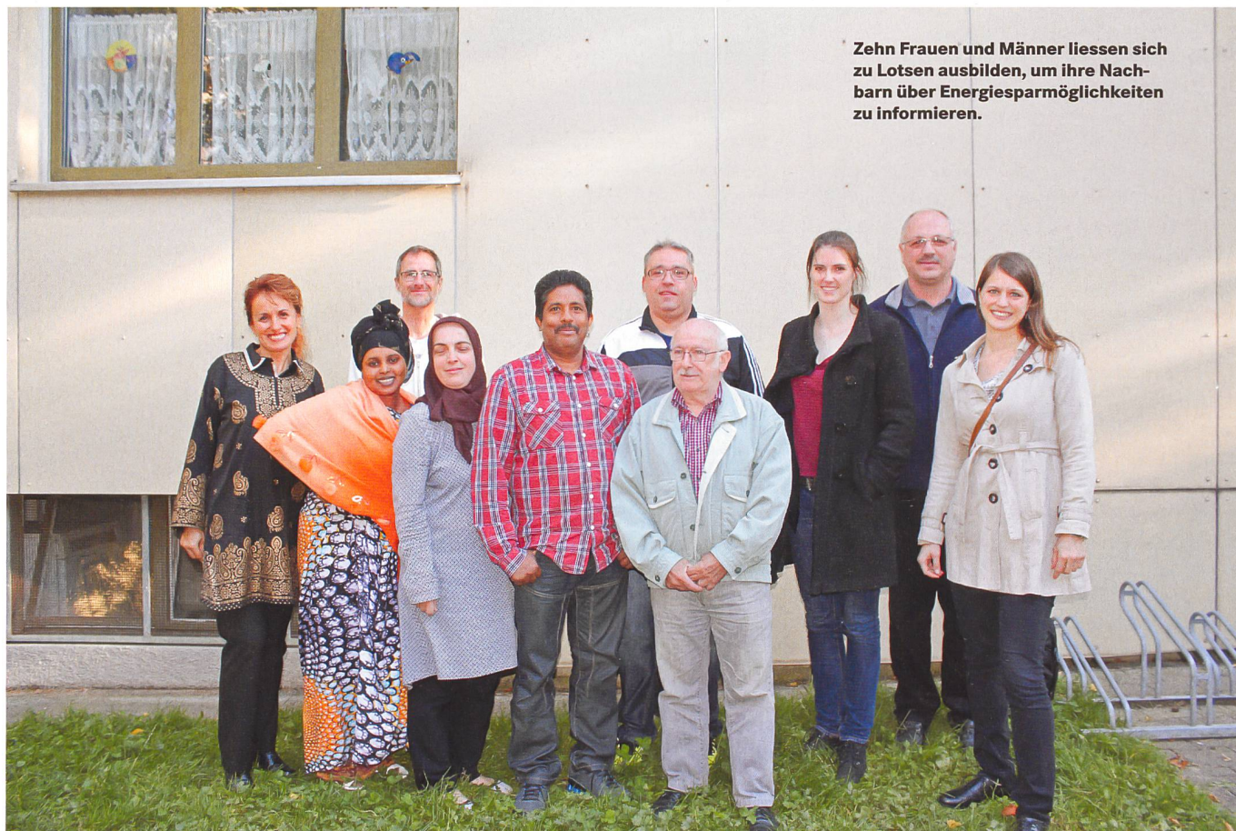
Zehn Frauen und Männer liessen sich zu Lotsen ausbilden, um ihre Nachbarn über Energiesparmöglichkeiten zu informieren.