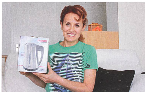
Zum Erfolg des Projekts hat beigetragen, dass passende Gratisartikel abgegeben wurden.

der Beratung nicht untergehe: «Die Abgabe der Artikel kann auch zu einer Erwartungshaltung führen.» Entscheidend für den Erfolg sei zudem eine begleitende Kommunikation auch von Seiten des Vermieters oder der Verwaltung, um die Teilnahme der Mieter zu fördern.