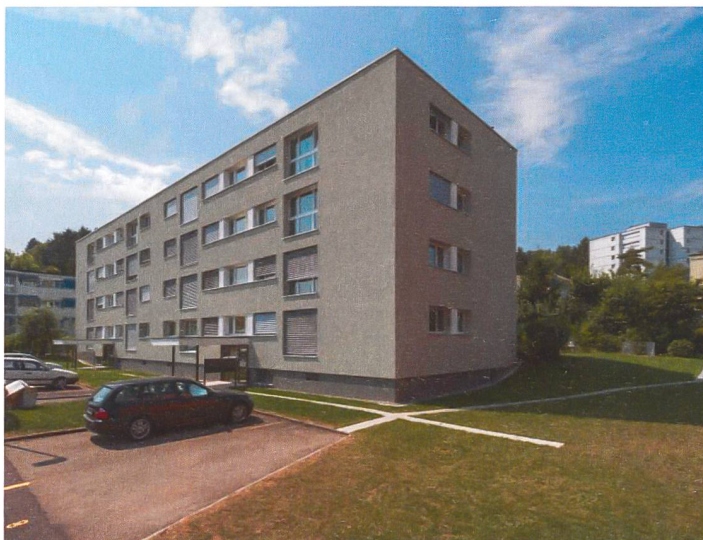
Gesamtsanierung MFH Am Brunnenbächli in Zollikerberg

Liegenschaftsanalysen Generalplanungen Bauleitungen