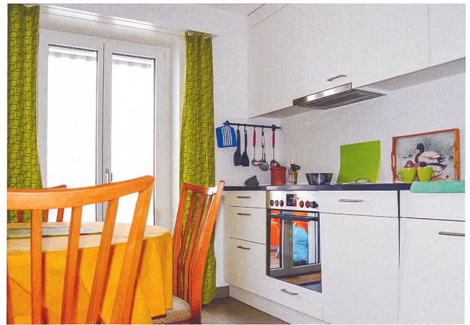
Blick in eine erneuerte Küche.