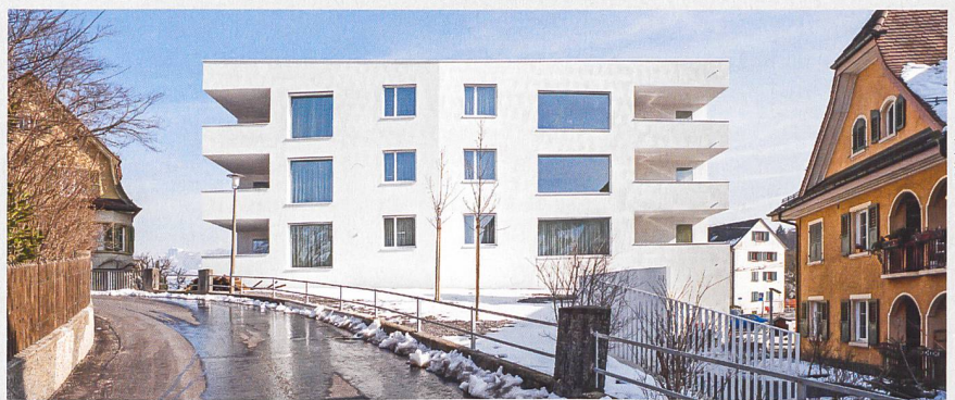
Mit dem neuen Zentrumsbau schuf die Wohn genossenschaft Geissenstein vor einigen Jahren altersgerechten Wohnraum und einen Quartierladen.

Das Kantonsgericht hat die Bau- und Zonenordnung streng ausgelegt und jene Einsprache gutgeheissen. Als Folge dieser Rechtsprechung ist in den Schutz zonen und damit auch im Geissenstein der Abbruch eines Gebäudes nur noch bei mangelhafter Statik oder wirtschaftlicher Unverhältnismässigkeit möglich. Damit ist jegliches Neubauprojekt vorläufig blo-