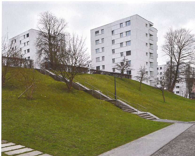
Unter der hinterlüfteten Fassade befinden sich 15 Zentimeter Dämmung. Die Fenster sind neu dreifachverglast.