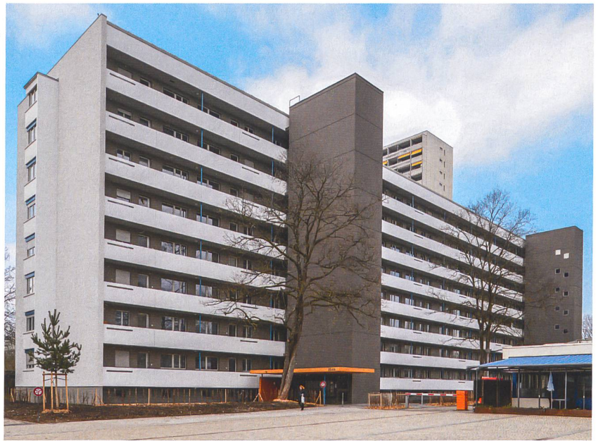
Die Ostseite blieb im Originalzustand erhalten. Hier baute man bloss die beiden Treppen- und Lifttürme von Grund auf neu.