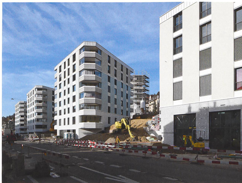
2 Im Vordergrund der tiefere Kopfbau, dahinter die Dreieckhäuser.