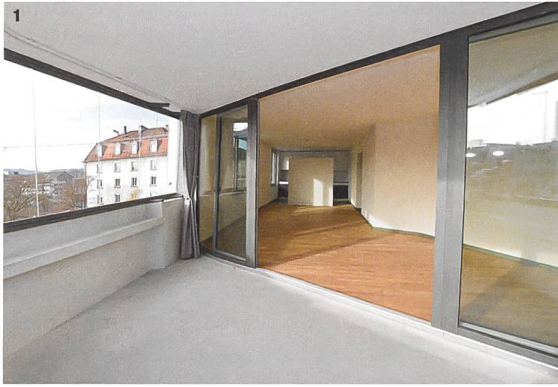
1/2 Wohn-Ess-Bereiche und Balkone liegen bei den Dreieckspitzen, was zu unkonventionellen Raumgrundrissen führt.