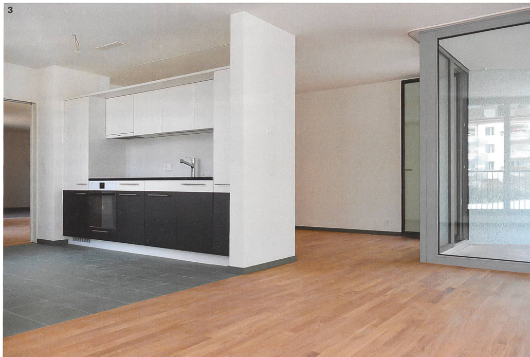
3 Die Küchen sind entweder offen zum Wohn-Ess-Bereich oder durch eine freistehende Küchenzeile teilweise abgegrenzt.