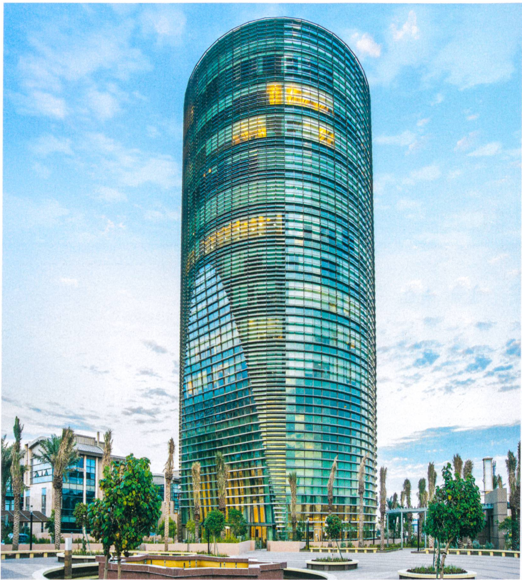
Alturki Business Park Al-Kohbar, Saudi Arabia