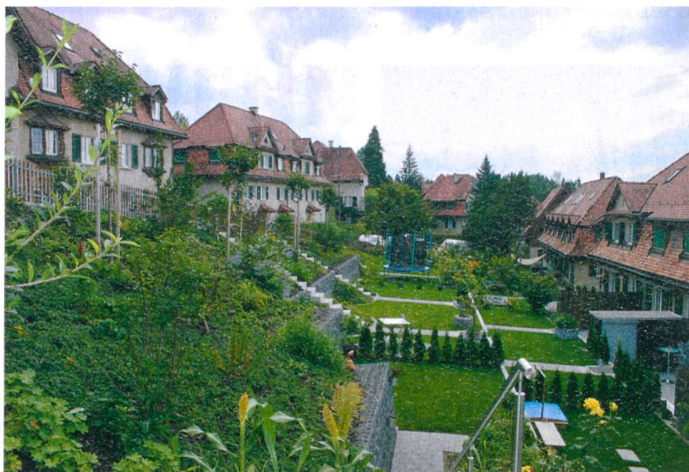
Die Vorgärten sind nach der Verlegung des Nahwärmenetzes wieder instand gestellt worden.