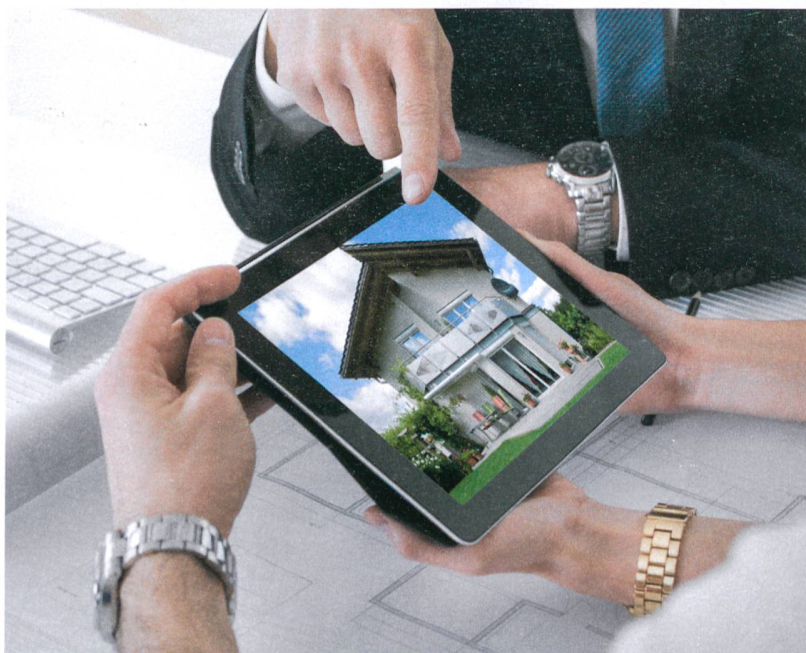
Ganzheitliche, objektspezifische Beratung bringt die massgeschneiderte Lösung.

In vielen Fällen (gerade im Sanierungsmarkt) sind hoch qualifizierte Energiespezialisten der Ansicht, dass die Ölheizung ökologischer sein kann als eine Wärmepumpe. Ihre Überzeugung: Wer sich blind für einen alternativen Energieträger entscheidet, kann in bestimmten Fällen der Umwelt sogar mehr Schaden zufügen. Es sei daher ein grosser Fehler, Wärmepumpen in einem Gebäude zu installieren, das dafür nicht geeignet ist. Wenn zum Beispiel die Vorlauftemperatur – das heisst die Temperatur des Wassers, das zu den Heizkörpern fliesst – hoch ist, führt das Ersetzen der Ölheizung durch eine Wärmepumpe zu einem deutlich überhöhten Stromverbrauch. In einem solchen Fall, vor allem bei Renovationen, sind die Luft-Wasser-Wärmepumpen ineffizient und daher meist ungeeignet. Ausserdem ist mit einer solchen Massnahme das Geld falsch investiert: Wer seine alte durch eine neue, energieeffiziente Ölheizung zum Preis von 15 000 bis 20 000 Franken ersetzt, spart gegenüber