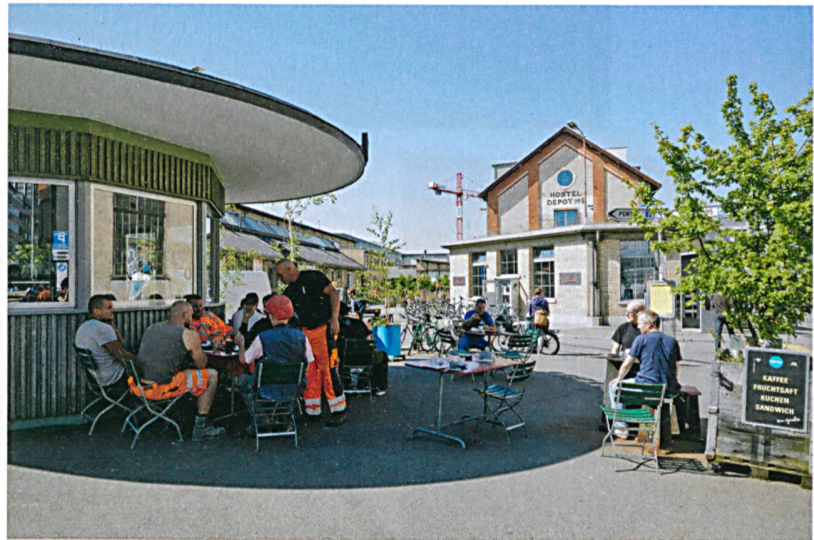
Zentrale Anlaufstelle des Lagerplatzes ist das Bistro «Portier», es ist Quartiertreffpunkt und Informationsdrehscheibe zugleich.

Ein überdachter Platz – eine ehemalige Kranbahn – wird vom Arealverein für regelmäßige Anlässe wie beispielsweise Nachtbazare genutzt.