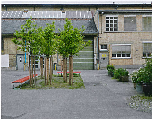
Bäume und Sitzgelegenheiten sorgen für weitere Auflockerung und Begegnungsmöglichkeiten.