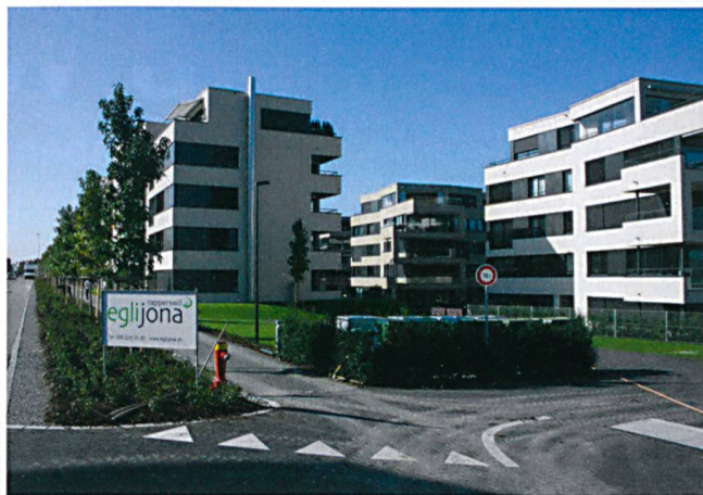
Bei der Überbauung «Luferwis» in Altendorf wurden 2300 Quadratmeter Klimaplaten verklebt.