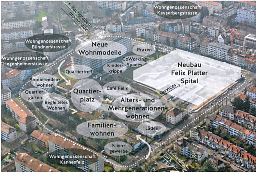
Exemplarisches Nutzungsschema zum Felix-Platter-Areal. Die Baugenossenschaft wird zwei Konzepte vorlegen – eines davon umfasst die Umnutzung bestehender Gebäude.

FELIX-PLATTER-AREAL Das Felix-Platter-Areal in Grossbasel bietet die Chance, ein genossenschaftliches Modellprojekt von ganz neuer Dimension in die Tat umzusetzen. Anstelle von Spital- und Personalhausbauten soll nämlich ein buntes Quartier mit 500 Wohnungen sowie sozialen, soziokulturellen und gewerblichen Nutzungen heranwachsen. Die Basler Regierung hat Ende März 2015 entschieden, dass das gesamte Areal für den genossenschaftlichen Wohnungsbau zur Verfügung steht. Nach der Fertigstellung des Spitalneubaus Ende 2018 könnte es losgehen.