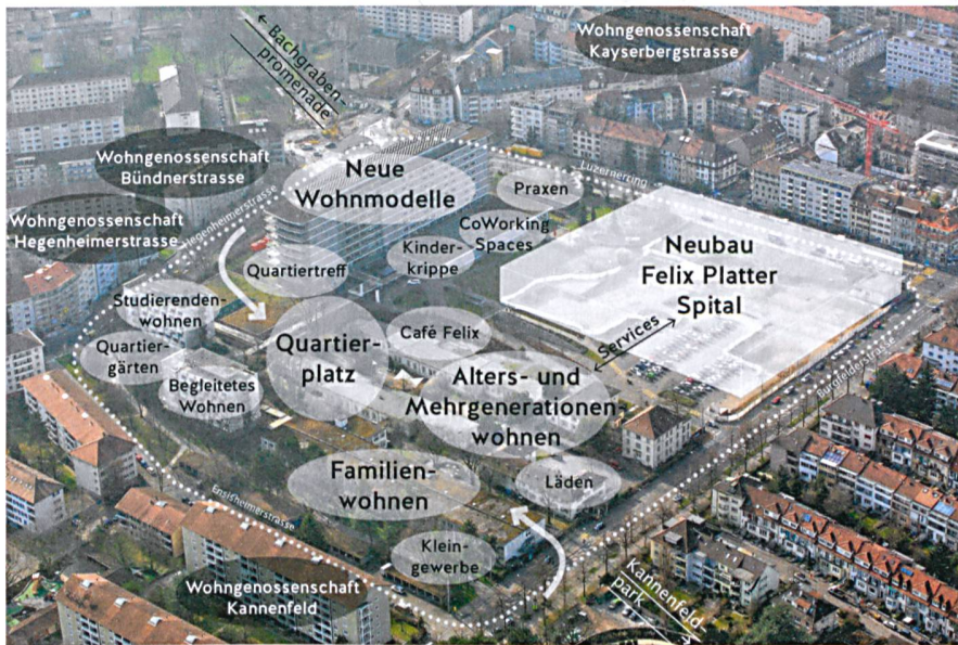
Exemplarisches Nutzungsschema zum Felix-Platter-Areal. Die Baugenossenschaft wird zwei Konzepte vorlegen – eines davon umfasst die Umnutzung bestehender Gebäude.

FELIX-PLATTER-AREAL Das Felix-Platter-Areal in Grossbasel bietet die Chance, ein genossenschaftliches Modellprojekt von ganz neuer Dimension in die Tat umzusetzen. Anstelle von Spital- und Personalhausbauten soll nämlich ein buntes Quartier mit 500 Wohnungen sowie sozialen, soziokulturellen und gewerblichen Nutzungen heranwachsen. Die Basler Regierung hat Ende März 2015 entschieden, dass das gesamte Areal für den genossenschaftlichen Wohnungsbau zur Verfügung steht. Nach der Fertigstellung des Spitalneubaus Ende 2018 könnte es losgehen.