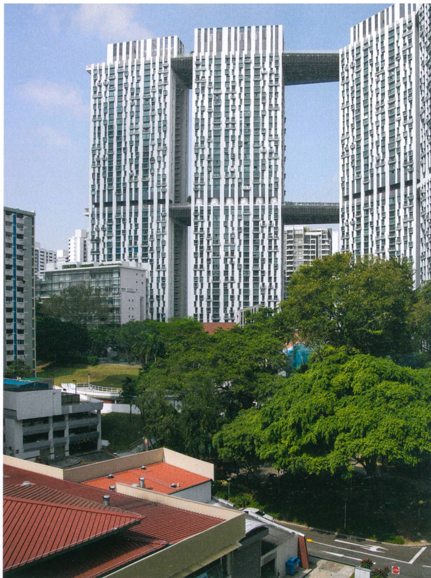
Im neuen Vorzeigeprojekt pinnacle@duxton verbinden zwei begehbare Plattformen die sieben fünfzigstöckigen Wohntürme.

In den letzten beiden Jahrzehnten wurde der allgemeine Lebensstandard deutlich angehoben. Das begünstigt eine immer stärkere Angleichung von HDBs und Condos. Unterscheiden sich HDBs der 1960er- bis 1980er-Jahre mit ihrem rohen Standardisierungsmodernismus noch deutlich von den wesentlich freier gestalteten Condos, werden jüngere HDBs ähnlich wie die Privatgebäude mit immer grösseren Glasanteilen an der Aus-