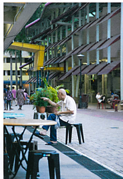
In vielen Hochhausblocks gibt es Läden und Esshallen.

Der staatliche Wohnungsbau war das vielleicht wichtigste Instrument, um die nationale Identität in der multikulturellen und vielsprachigen Gesellschaft Singapurs zu fördern. Das Erfolgsmodell HDB gerät jedoch in den letzten Jahren zunehmend unter Druck. Die Preise im Wohnungssektor steigen weit stärker als die Einkommen, was insbesondere für junge Familien, die Wohneigentum erwerben möchten, zu einer immer grösseren Belastung wird. In den Anfangsjahren wurden die Preise von HDB so festgelegt, dass sich siebzig Prozent aller Haushalte eine Vier-Zimmer-Wohnung und sogar neunzig Prozent eine Drei-Zimmer-Wohnung leisten konnten. Je länger, desto mehr begünstigt das Finanzierungssystem von HDB-Wohnungen aber gut verdienende, ältere Personen, die sich teilweise gleich mehrere Wohnungen kaufen können.