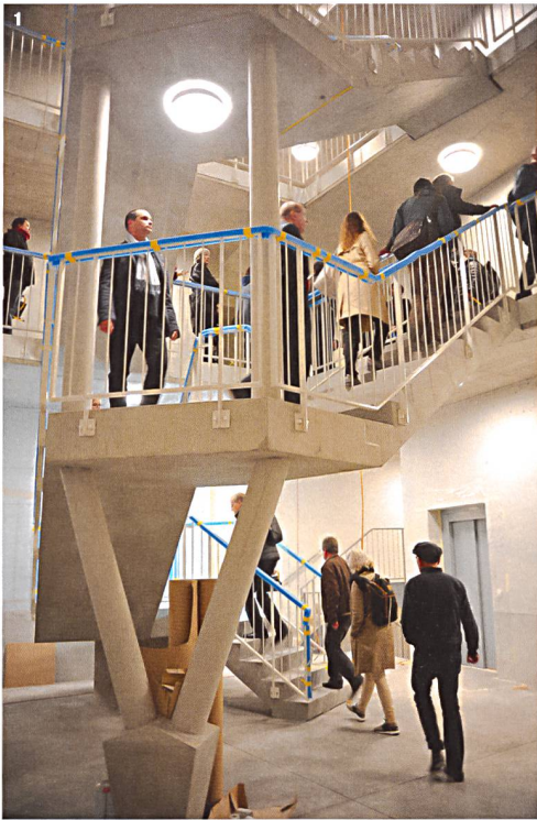
1 Spektakuläre Architektur bis ins Treppenhaus: Hunziker-Areal.