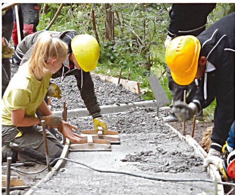
Impressionen vom Pack's-Lehrlingslager 2014 in Flühli im Entlebuch.