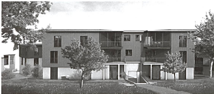
So wird sich die Siedlung auf der Gartenseite, auf der Strassenseite sowie in den Höfen präsentieren.

Das Preisgericht attestiert dem Entwurf «ein identitätsstiftendes Bild» und eine «zukunftsorientierte Form des Zusammenlebens». Die Architekten selbst verwiesen an der Vernissage auf die Verankerung ihres Projekts in der geometrischen Struktur der frühen Gartenstadt. Als Vorbild habe auch der traditionelle Grossbauernhof gedient, wo sich Wohn- und Wirtschaftsgebäude um einen Hof gruppieren.