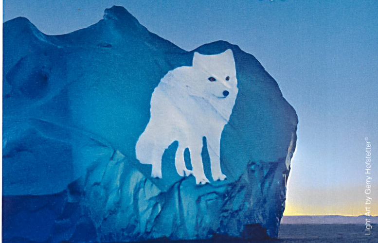
Light Art by Gerry Hofmeister®

Werden auch Sie Klimaschützer. Reduzieren Sie den Energieverbrauch über EgoKiefer Fenster um bis zu 75% – an 13 Vertriebsstandorten und über 350 Fachbetriebspartnern in der Schweiz: egokiefer.ch