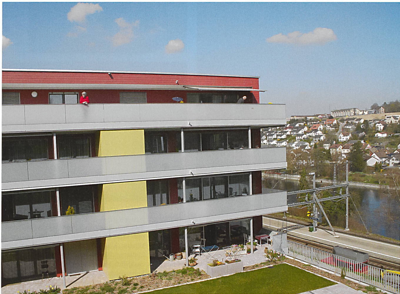
Bilder: Wohnen / Relistab Partner Architekten

Mit der Neubausiedlung «Rhysicht» bietet die Wohnbaugenossenschaft Waldpark nicht nur zeitgemässe Alterswohnungen. Die Bewohnerschaft geniesst auch gemeinschaftliche Einrichtungen und die Dienstleistungen des nahen Alterszentrums. Und dank dem zumietbaren Hobbyraum muss niemand sein Steckenpferd aufgeben. Kein Wunder, dass die Nachfrage gross war.