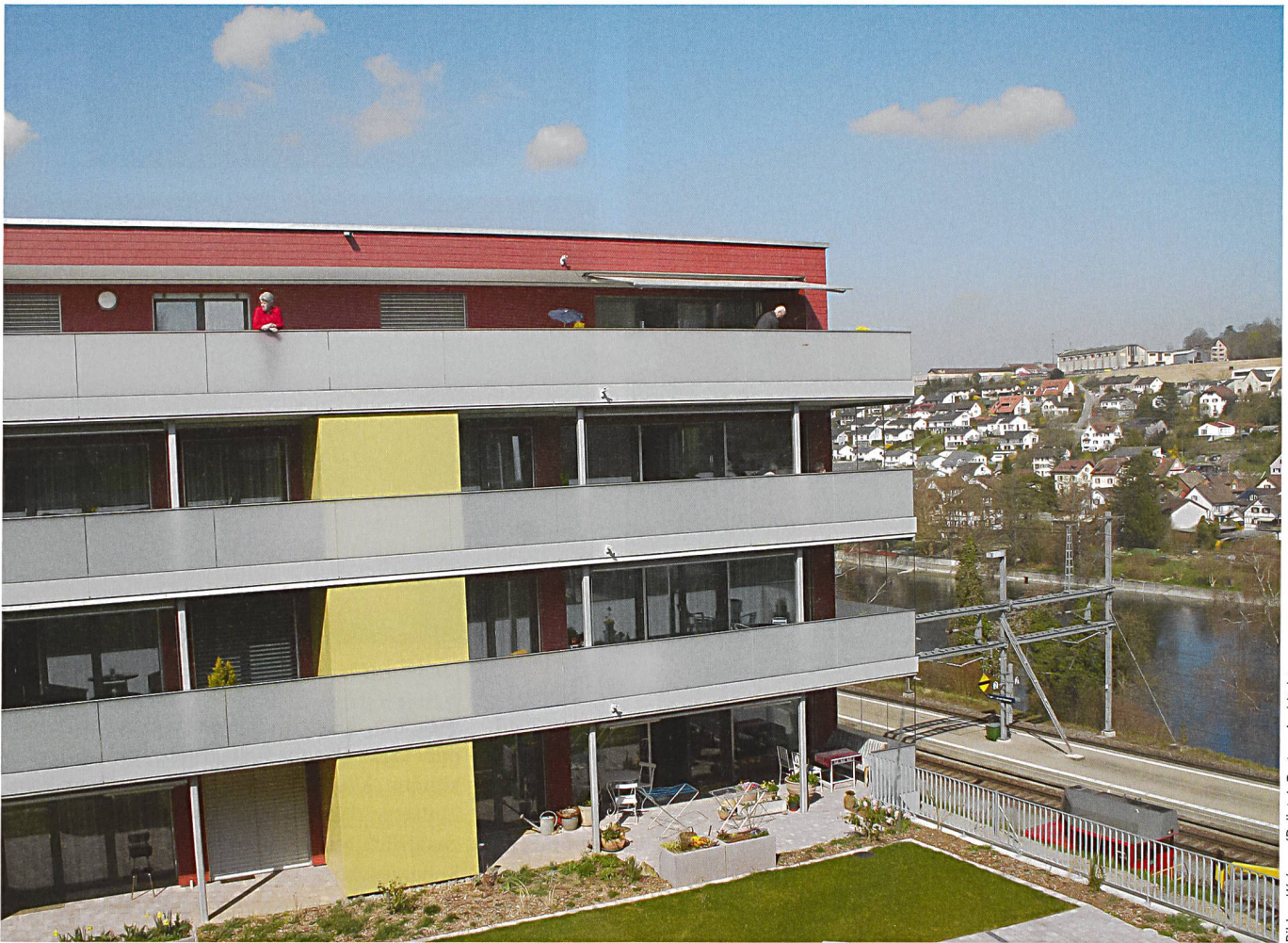
Bilder: Wohnen / Relistab Partner Architekten

Mit der Neubausiedlung «Rhysicht» bietet die Wohnbaugenossenschaft Waldpark nicht nur zeitgemässe Alterswohnungen. Die Bewohnerschaft geniesst auch gemeinschaftliche Einrichtungen und die Dienstleistungen des nahen Alterszentrums. Und dank dem zumietbaren Hobbyraum muss niemand sein Steckenpferd aufgeben. Kein Wunder, dass die Nachfrage gross war.