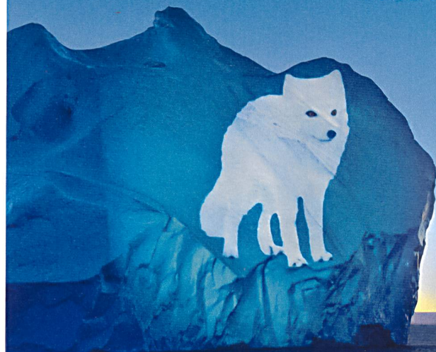
Light Art by Gerry Holstetter

Werden auch Sie Klimaschützer. Reduzieren Sie den Energieverbrauch über EgoKiefer Fenster um bis zu 75% – an 13 Vertriebsstandorten und über 350 Fachbetriebspartnern in der Schweiz: egokiefer.ch