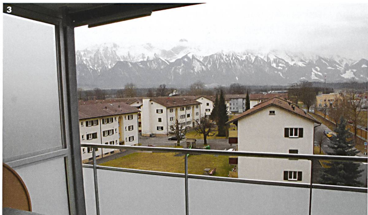
3 Blick vom neuen Balkon auf die erste Bauetappe aus den 1940er-Jahren und die Bergkulisse, die auch an einem trüben Tag eindrücklich ist.