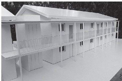
Die drei Häuser mit insgesamt 22 Wohnungen entstehen in zwei Etappen. Die erste Etappe (rechts auf dem oberen Bild sowie Bild links) steht vor dem Abschluss. Das schützenswerte Bauernhaus im Vordergrund gehört zum Ensemble.