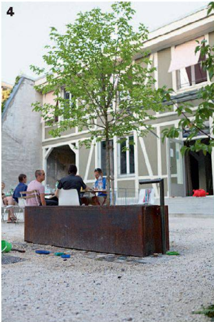
4–6 Ein Brunnen, den man mittels Fusspedal bedient, sowie Geräte aus rohen Holzstämmen laden die Kinder zum Spiel.