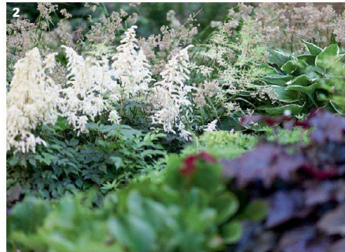
1/2 Die Beete im Randbereich bieten eine Vielfalt von Gräsern, Stauden und Sträuchern – Grüntöne harmonisieren mit dezenten Blütenfarben.