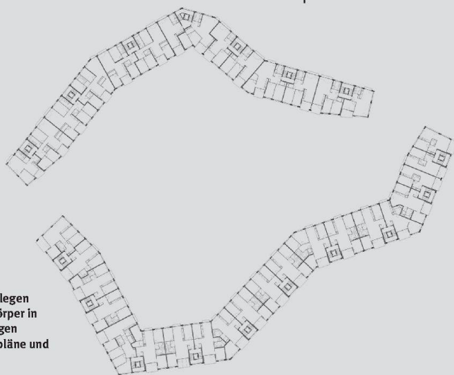
Mit Knicken und Abstufungen legen sich die beiden mächtigen Baukörper in den Hang und um den grosszügigen Innenhof (siehe auch Situationspläne und Grundrisse auf S. 26 bis 29).

ge das Parkierungsproblem im Quartier zu lösen. Überzeugt haben auch die Grundrisse des Vorschlags von Ballmoos Krucker Architekten (siehe auch Seite 26 bis 29). Mit drei verschiedenen Grundrissstypen reagieren die Architekten auf die unterschiedlichen Situationen gegen die beiden Strassen hin. Die Schlafräume liegen jeweils an der ruhigen Hofseite, sämtliche Wohnungen sind aber sowohl zum Üetliberghang als auch zur Sonne und Aussicht über die Stadt ausgerichtet. Dieses «Durchwohnen» schafft grosse, zweiseitig orientierte Wohn-Ess-Räume.