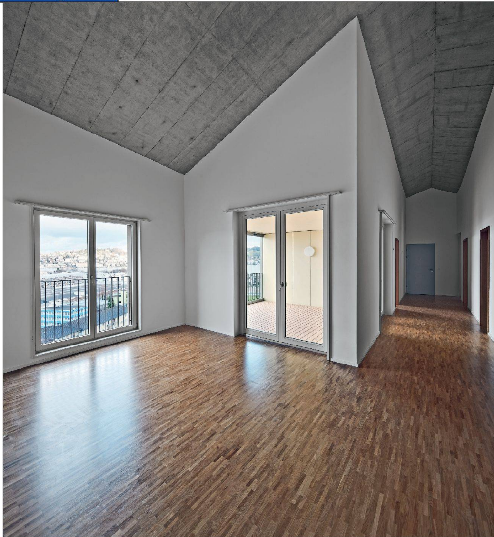
Die Dachwohnungen bieten bis fünf Meter Raumhöhe.

Wer im Weinbergli-Neubau das Gewöhnliche sucht, ist definitiv an der falschen Adresse. Die insgesamt 36 Wohnungen – von der 2½-Zimmer-Wohnung bis zur 4½-Zimmer-Maisonette – bestechen durch ihre Grundrisse und Gestaltungselemente. Alle Wohnungen sind zweiseitig orientiert, so dass die Bewohner gleichzeitig gegen Südost Sonne tanken und gegen Nordwest die Aussicht auf die Stadt geniessen können. Wettergeschützte Loggien und bergseitige