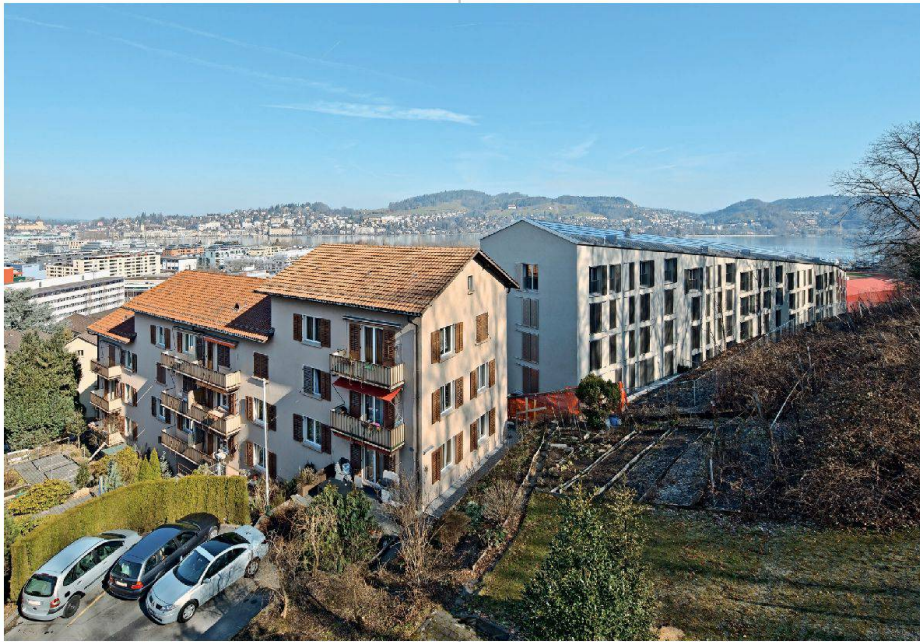
Alt und Neu vereinen sich am Weinbergli.