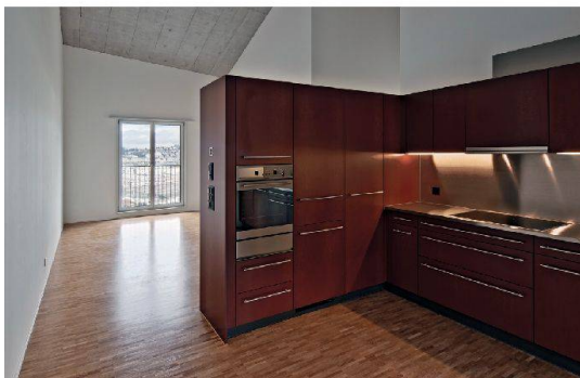
Das starke Braunrot der Küchen steht in Kontrast zu den übrigen Farben.