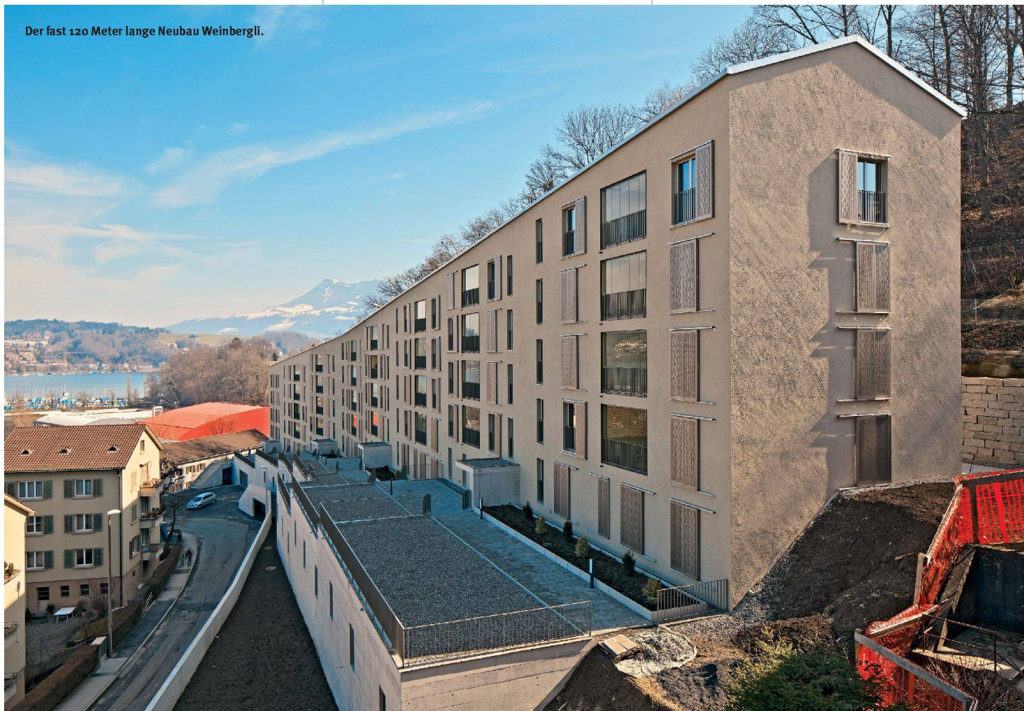
Der fast 120 Meter lange Neubau Weinbergli.

zur Verdichtung. Die ABL schrieb deshalb im Jahr 2007 einen Architekturwettbewerb aus, der nicht nur eine umfassende Sanierung und Anpassung an die heutigen Wohnbedürfnisse zum Ziel hatte. Durch den Abbruch von drei Einfamilienhäusern sollte zudem neuer, zeitgemässer Wohnraum entstehen. Gefragt war ein Um- und Neubauprojekt, das einen sorgfältigen Umgang mit