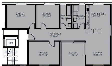
Grundriss einer 4 1/2-Zimmer-Wohnung.