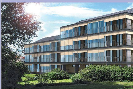
So werden sich die renovierten Häuser präsentieren. Dank einer Verandaschicht entsteht mehr Wohn- und Balkonraum.

Mit der Investition von 21,55 Millionen Franken im oberen Weinbergli setzt die ABL ihre langfristig geplante Sanierungs- und Erneuerungsstrategie fort. Ein zeitgemässer Wohnungsstandard sichert die Vermietung auf lange Sicht. Der Mietzins für die 3-Zimmer-Wohnungen liegt nach der Erneuerung bei 1500 Franken.