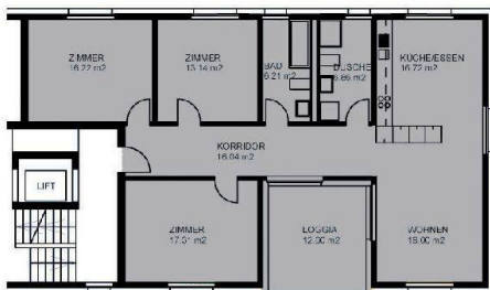
Grundriss einer 4 1/2-Zimmer-Wohnung.