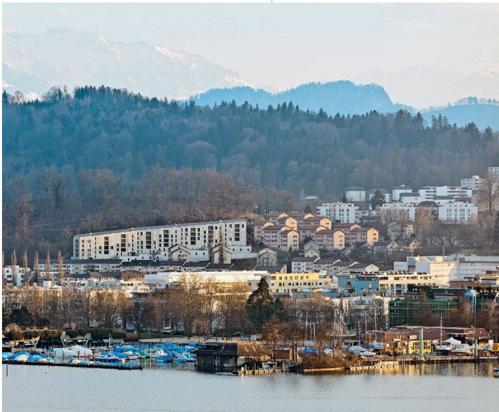
Präsenz markiert der Neubau auch von weitem.