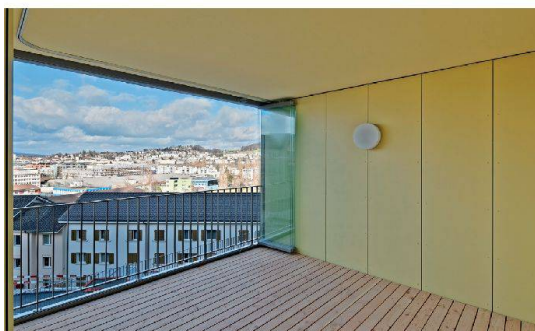
Dank schiebbarer Verglasung sind die Loggien einen grossen Teil des Jahres nutzbar.

Sitzplätze bieten den unteren Wohnungen zusätzlichen privaten Aussenraum. Ausser den oberen 2½-Zimmer-Wohnungen verfügen alle Einheiten über eine Loggia. Raumhohe Fenster lassen den Blick frei auf die Stadt und den See, der von jeder Wohnung aus – teils mehr, teils weniger – zu sehen ist.