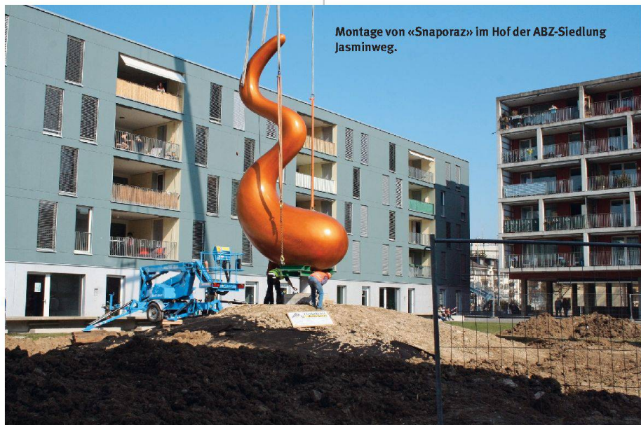
Montage von «Snaporaz» im Hof der ABZ-Siedlung Jasminweg.