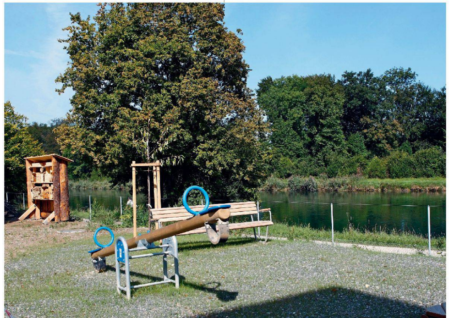
Ein Aspekt des Aussenraumkonzepts der SGE, das auf Artenvielfalt setzt: das Bienenhotel (links).