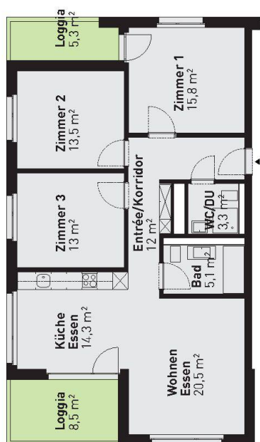
Grundriss einer 4 1/2-Zimmer-Wohnung.

vor einiger Zeit ein Konzept entwickeln lassen. Dieses verlangt unter anderem, dass bei Sanierungen und Neubauten der Artenvielfalt besondere Beachtung zukommt (siehe wohnen 07-08/2010). Der Limmat-