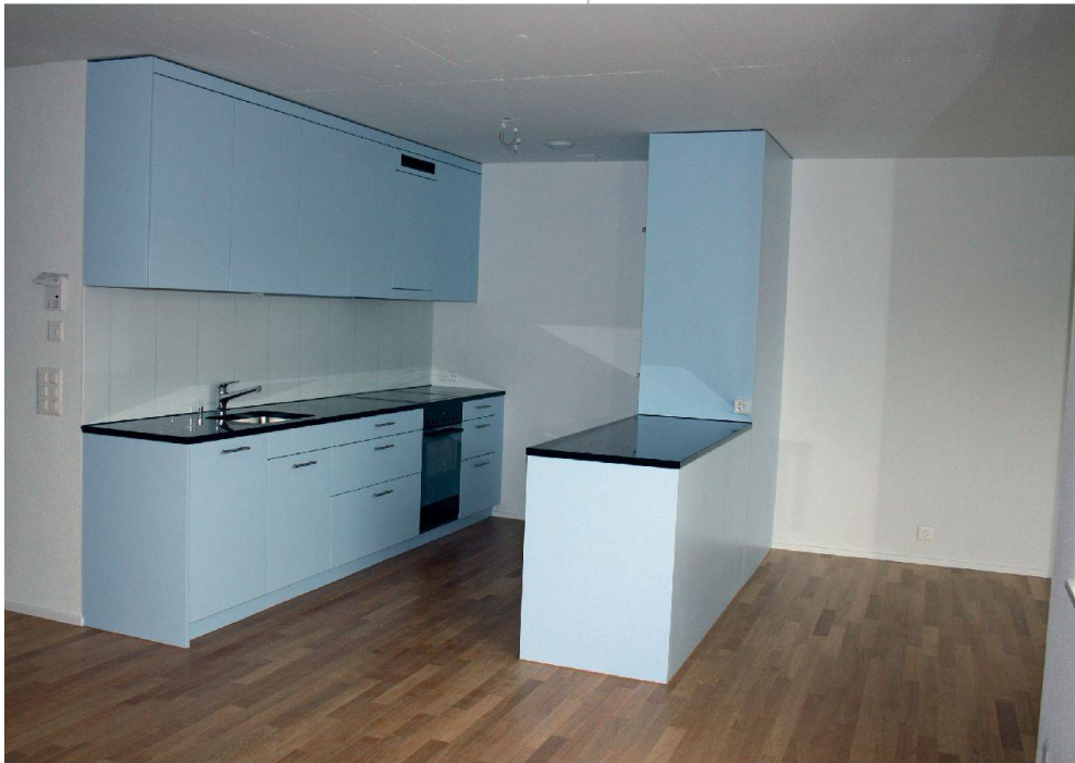
Beim Innenausbau konnte die Genossenschaft den Standard und die Materialien bestimmen. Das Resultat: durchgehender Eichenparkett und Sichtbetondecken.

berg liegt, sind 42 Wohnungen entstanden. Acht davon sind für Mieter mit sehr tiefen Einkommen subventioniert. Ein Blick auf den Wohnungsmix macht klar, dass sich die Überbauung in erster Linie an Familien richtet. Mit rollstuhlgängigen 2-Zimmer-Atelier-Wohnungen und 3½-Zimmer-Wohnungen will die SGE aber auch anderen Haushaltsformen gerecht werden. Ganz bewusst sind die kleineren Wohnungen in