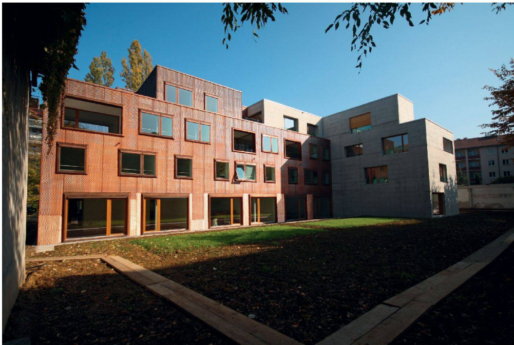
Auf der Rückseite besitzt jede Maisonnette ihren Sitzplatz und damit direkten Zugang zum (noch nicht bepflanzten) Garten.