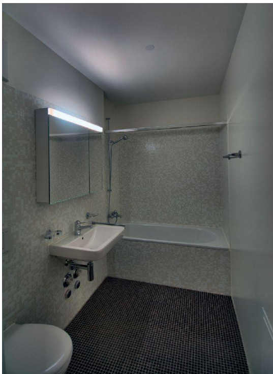
Elegant kommen die Bäder daher.

warfen einen Solitär, der so in den Hinterhof eingepasst ist, dass er einen Kontrast zum Bestand bildet, aber auch an die bauliche Geschichte des Areals erinnert. Der Hofkomplex wird nämlich bereits 1880 als «Hegenheimer Schlössli» geschichtlich erwähnt. Eine Besonderheit ist denn auch die Wahl der Fassade aus Kupfer und Sichtbeton, die für tiefe Unterhaltskosten sorgt. Unter dem wabenartigen Kupferblech ver-