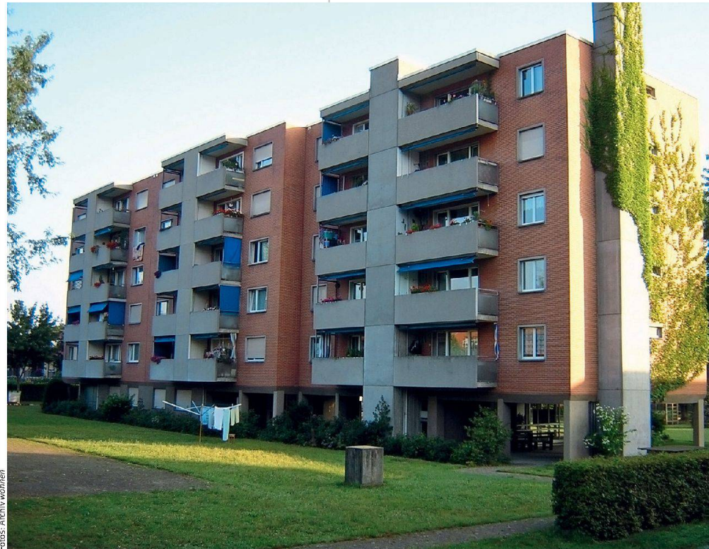
Bei einer Sanierung oft das Erste, das ansteht: kleine und schlecht isolierte Balkone. Im Bild die Siedlung Käppeli der BG zum Stab vor der Sanierung.