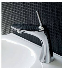
Titelbild: Unkonventionelle Formensprache und doch schlicht und modern: So sehen die neuen Badprodukte aus.

Rebecca Omoregie, Redaktorin wohnen@wbg-schweiz.ch