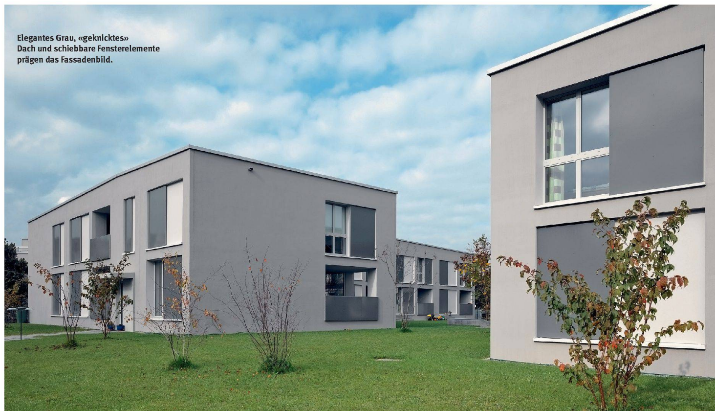
Elegantes Grau, «geknicktes» Dach und schiebbare Fensterelemente prägen das Fassadenbild.

Um ein breites Angebot sicherzustellen, ersetzte die Allgemeine Wohnbaugenossenschaft Aarau und Umgebung (Abau) nur einen Teil ihrer Siedlung Bühlacker. Dabei wählte sie eine Kombination von Etagenwohnungen und Reihenhäusern.