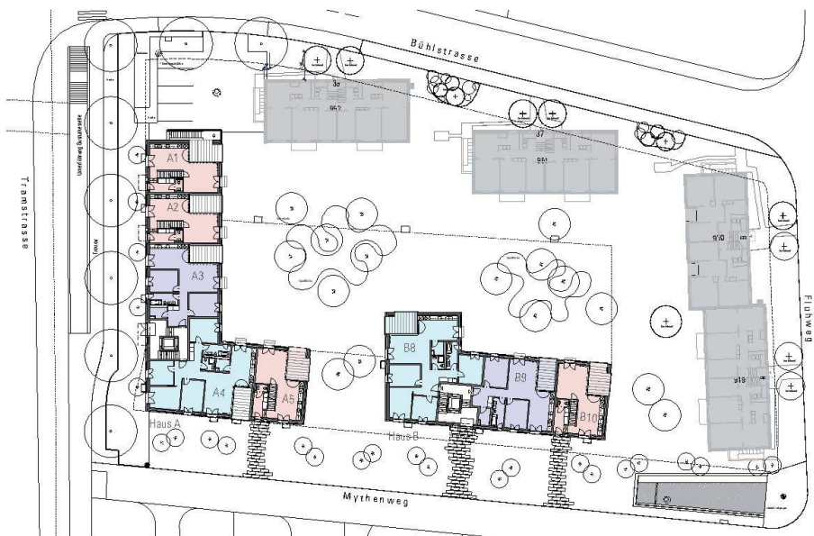
Neu und alt in der Siedlung Bühllacker.

In den letzten Jahren wurde in der Region Aarau viel gebaut. Am Bezugstermin 1. April 2011 waren denn auch noch drei Wohnungen frei, gut ein halbes Jahr später ist es