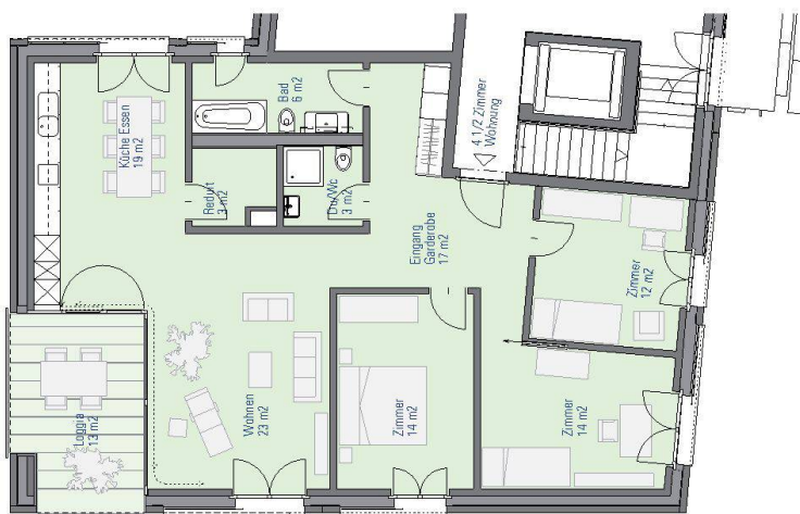
Grundriss einer 4½-Zimmer-Wohnung mit 125 Quadratmetern Wohnfläche.

Buchs zeigt, dass auch ein Teilrückbau Sinn machen kann, wenn dies zur Strategie der Genossenschaft und den Umständen passt. Im Bühlacker verband man zudem auf geschickte Weise die Geschosswohnung mit dem Reihenhaus – eine beliebte Wohnform, die jedoch im genossenschaftlichen Neubaumarkt kaum noch zu finden ist.