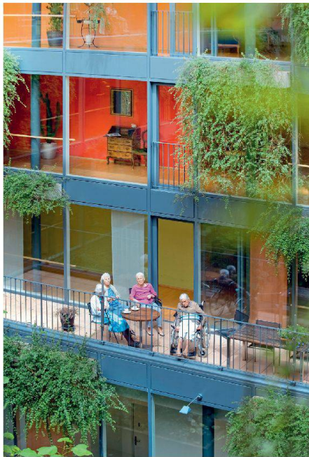
Ort der Begegnung: Age-Preisträger Alters- und Pflegeheim Bachgraben in Allschwil.