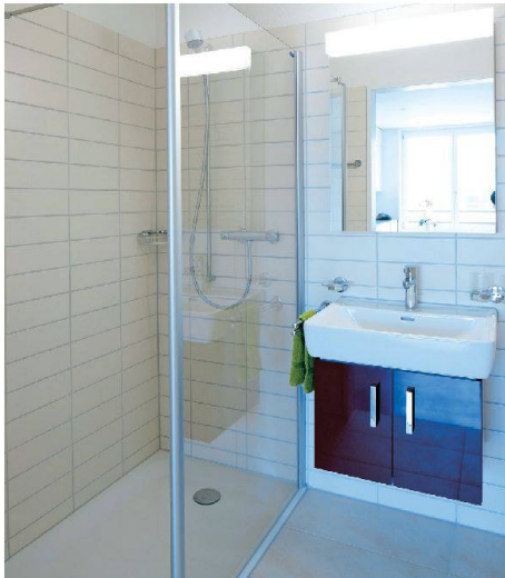
Die kleineren Einheiten verfügen nur über Duschen, dafür gibt es ein Gemeinschafts-Pflegebad.