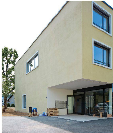
Eingang zum «Gemeinschaftshaus», das unter anderem Café, Pflegebad, Fitnessraum und Spitex beherbergt.