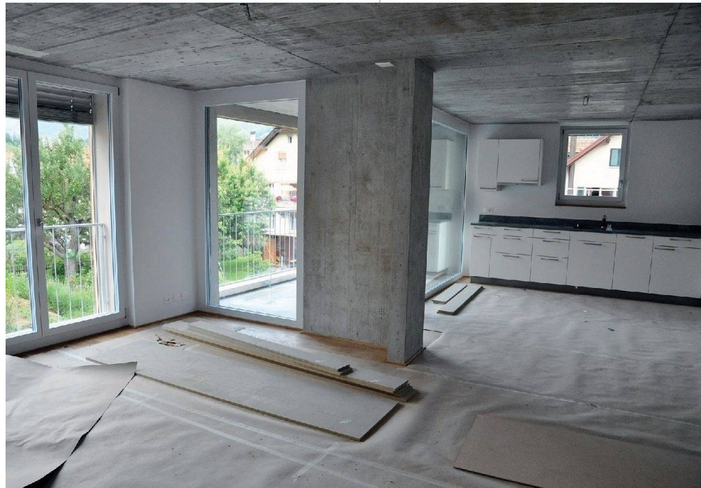
Blick in die Wohnungen kurz vor Vollendung.