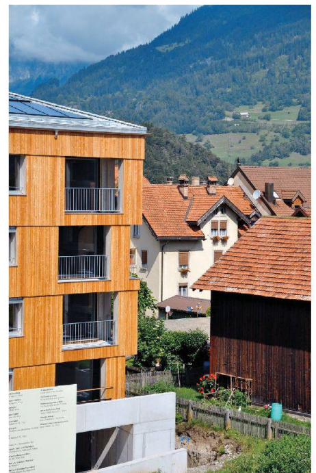
Bonaduz ist ausgezeichnet erschlossen, die Natur liegt vor der Haustüre.