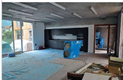
Herz der Siedlung ist der Gemeinschaftsraum mit Cheminée.

ins Wohnungsinne. Eine hochdämmende, dichte Gebäudehülle minimiert den Wärmeverlust und hält im Sommer die Hitze ab. Komfortlüftungen mit Wärmerückgewinnung sorgen auch während der kalten Jahreszeiten stets für gute Luft, ohne dass wertvolle Wärme durch Fensterlüftung verloren geht. Warmwasser wird mit 76 Quadratmetern Sonnenkollektoren aufgeheizt; Restenergie liefert eine kleine, vollautomatische Holzpellettheizung im Keller.