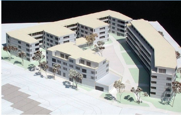
So präsentiert sich die Neubausiedlung Schächli, die rund achtzig Wohnungen umfasst. Die Siedlungsgenossenschaft Eigengrund übernimmt Haus C (links), die Gemeinnützige Baugenossenschaft Schächli die Häuser A und B.