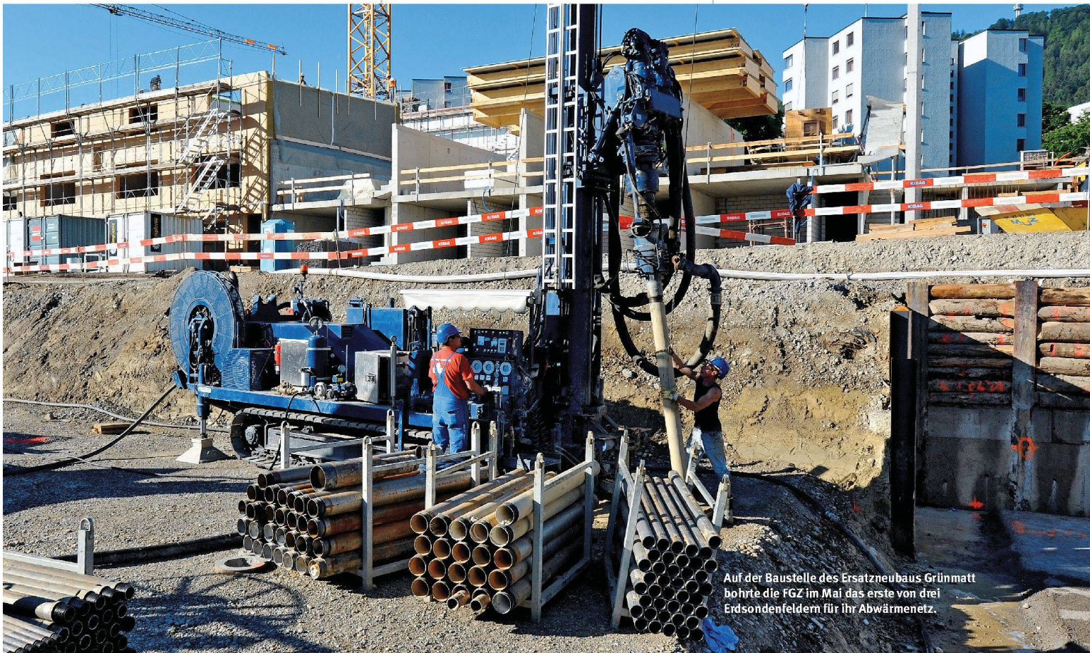
Auf der Baustelle des Ersatzneubaus Grünmatt bohrte die FGZ im Mai das erste von drei Erdsondenfeldern für ihr Abwärmenetz.

Der Vorstand setzte deshalb eine Arbeitsgruppe «Energiekonzept» ein. Ziel war es, den CO 2 -Ausstoss und Energiebedarf zu senken und möglichst nachhaltig zu de-