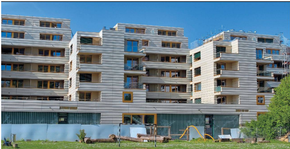
Betrachtet nicht nur bauliche Aspekte: Die Siedlung Badenerstrasse der Baugenossenschaft Zurlinden ist das erste Gebäude, das gemäss der Vision der 2000-Watt-Gesellschaft erstellt wurde.

lerweile eine eigentliche Kettenreaktion in Gang gesetzt. So ist auch die Norm SIA 380/1 «Thermische Energie im Hochbau» angepasst worden. Die Norm definiert die Energiekennwerte eines Gebäudes und muss bei der Baueingabe zwingend beachtet werden.