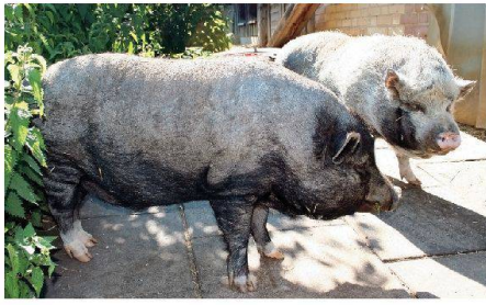
Grosses «Tierfest» in der St. Galler Siedlung Remishueb. Im Hintergrund die Scheune, wo die Ställe untergebracht sind.