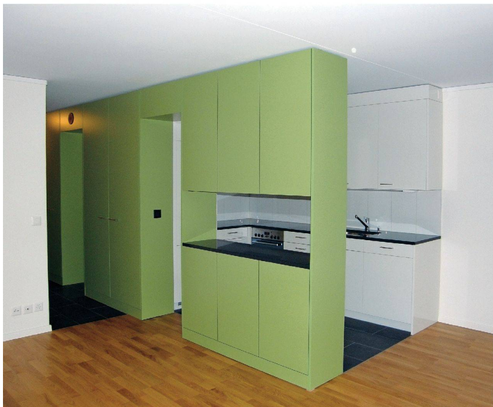
Frische Farben und natürliche Materialien zeichnen die erneuerten Wohnungen aus.

Die Fassadensanierung umfasst den Ersatz sämtlicher Fenster, die Isolation der Aussenhüllen, die Erneuerung der Türen sowie die Instandstellung der Betonoberflächen. Neue Rollläden, Sonnenstoren und Balkongeländer vervollständigen diesen Sanierungsteil. Glücklicherweise gaben die anderen am Gebäude beteiligten Eigentümer ihr Einverständnis, sich an der Fassadensanierung zu beteiligen. Somit wird nach Abschluss der Arbeiten das gesamte Gebäude in einem neuen Antlitz erscheinen.