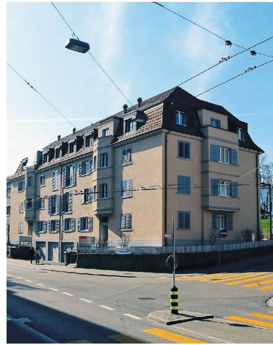
Eingangsseite (Mutschellenstrasse): Dank schallsolierten Fenstern bleibt der Lärm draussen.