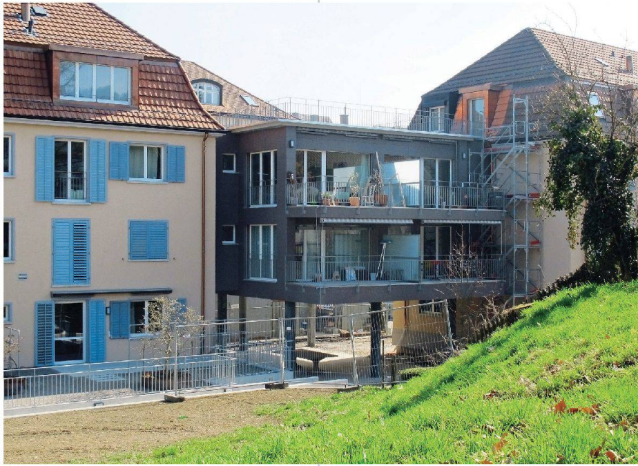
Mit zwei Zwischenbauten schafft die BGZ 2 rund 500 Quadratmeter zusätzliche Wohnfläche.