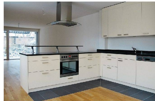
Küche im Zwischenbau.