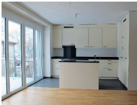
Die erneuerten Wohnungen verfügen über moderne, offene Küchen.