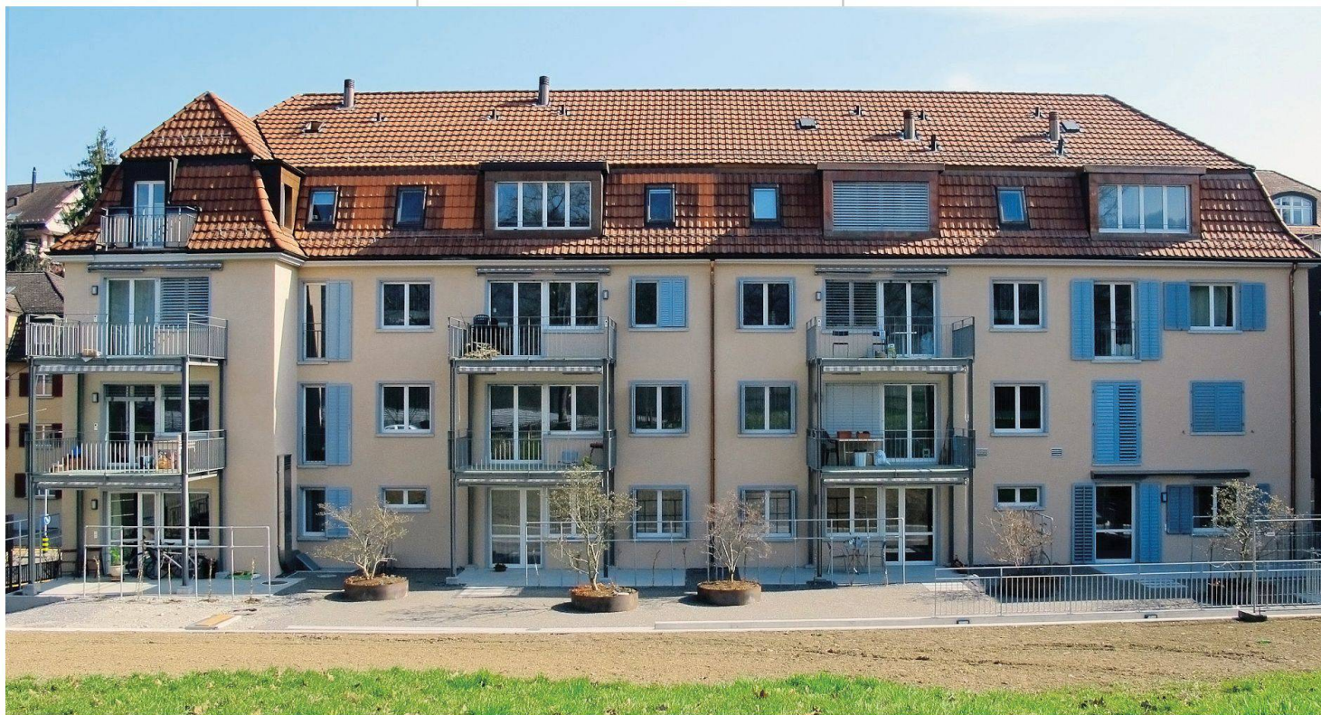
Gartenseite: Die Häuser erhielten eine Isolierung und neue Fenster, vergrösserte Balkone bieten mehr Wohnwert.

SVW erarbeitete der Vorstand daraufhin eine strategische Planung, die mögliche Szenarien für die Erneuerung umfasste.