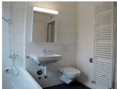
Auch die Bäder wurden rundum erneuert.