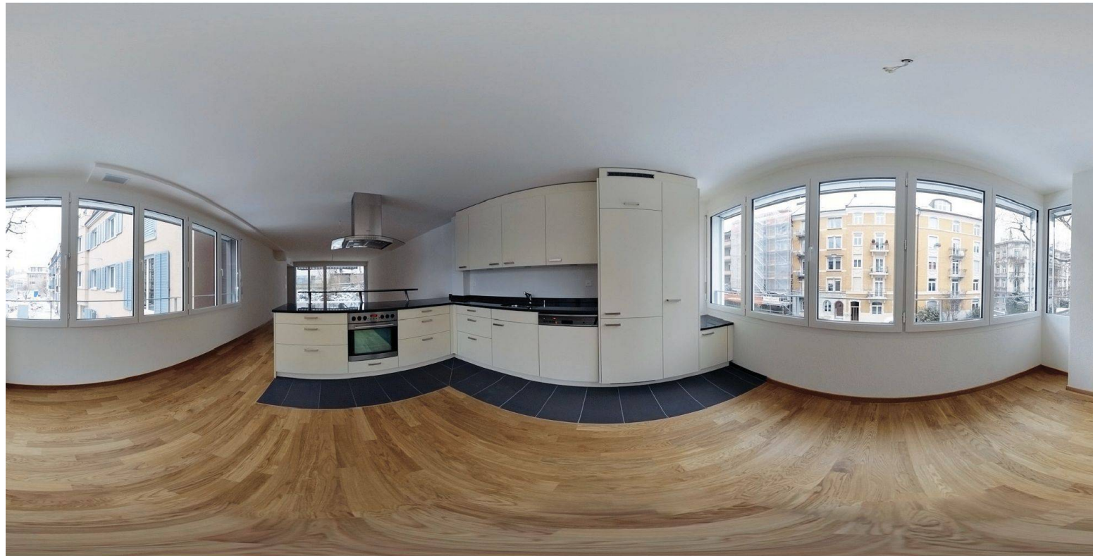
In zwei Zwischenbauten entstehen grosszügige Wohn-Ess-Räume mit offenen Küchen (Panoramaaufnahme).

BGZ 2 wertet Wohnungen auf und saniert nach Minergiestandard