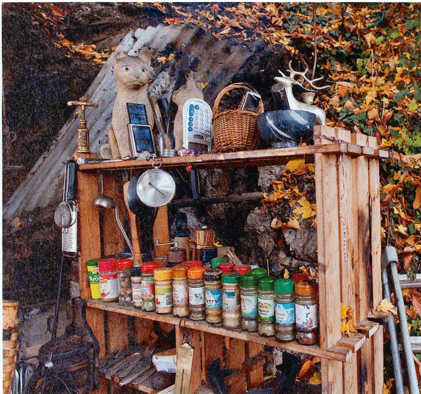
Gekocht und geheizt wird über dem offenen Feuer.

Bücher. Zum Beispiel «Das grosse Buch vom Klima». Er zeigt auf, was jetzt alles passiert. Ich befasse mich mit etwa zwanzig Wissensgebieten – Klimatologie, Meteorologie, Ökologie.