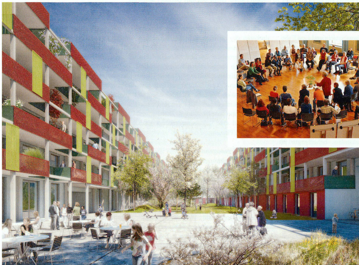
Will Jung und Alt zusammenbringen: Mehrgenerationenhaus der Gesewo in Winterthur.

Noch diesen Frühling möchte die Gesewo mit dem Bau beginnen. In verschiedenen Arbeitsgruppen und Workshops sind die Mitglieder des Vereins «Gieserei» eifrig daran, das Leben im Mehrgenerationenhaus zu planen. Doch wie will die Genossenschaft sicherstellen, dass die utopisch anmutenden Ideen sich tatsächlich so umsetzen lassen?