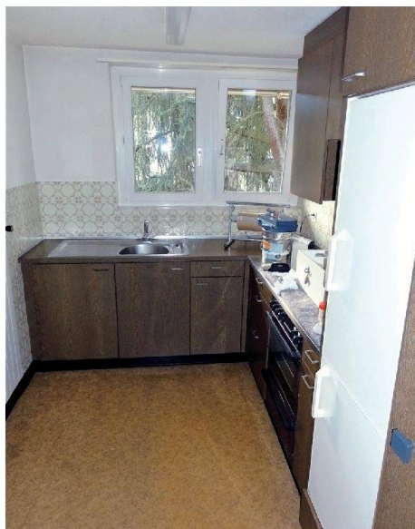
Küchen und Bäder bieten wieder heutigen Komfort (links: Küche im früheren Zustand).