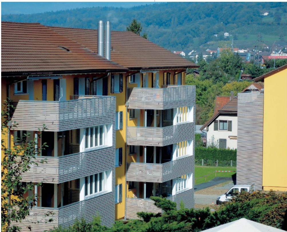
Blick auf zwei Gebäudezellen: Die neuen Anbauten bestimmen das Erscheinungsbild.

Im Hausinnern ging es zum einen um den kompletten Ersatz des Leitungsnetzes sowie den Einbau neuer Bäder und Küchen. Dabei stellt die Genossenschaft zwar einen guten Standard zur Verfügung – so gibt es etwa neu einen Geschirrspüler –, übte aber auch hier Kostendisziplin. So entschied man sich gegen den heute weit verbreiteten Naturstein und baute günstigere Kunstharzabdeckungen ein – die sich mit ihrem