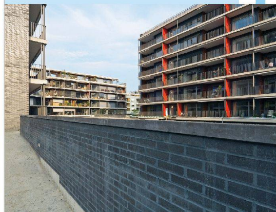
Die Luzerner Baugenossenschaften sollen bei städtischen Entwicklungsschwerpunkten stärker zum Zug kommen. Das fordert das G-Net, ein Zusammenschluss von Luzerner Genossenschaften. Chancen für eine genossenschaftliche Beteiligung gibt es durchaus, wie das Beispiel der erfolgreichen Neubausiedlung Tribschentstadt der ABL zeigt.