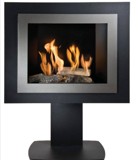
Einfach vor die Wand gestellt: Ethanolöfen bergen jedoch verschiedene Gefahren.

Der Gefahren rund um die künstliche Gemütlichkeit sind sich auch die Schweizer Behörden bewusst. Die Beratungsstelle für Unfallverhütung hat deshalb ein Merkblatt herausgegeben, das nicht nur auf die verschiedenen Gefahrenquellen hinweist, sondern auch die – durchaus vorhandenen – gesetzlichen Grundlagen für den Betrieb solcher Geräte auflistet ( www.bfu.ch , Suchstichwort «Ethanol»).