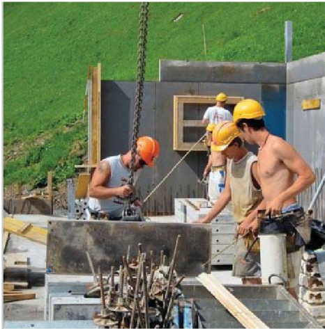
Anpacken für einen guten Zweck: Lernende der Robert Spleiss AG und der Jäggi + Hafter AG erstellen für eine Bergbauernfamilie einen neuen Stall.

Drei ganz besondere Projektwochen gab es diesen Sommer für 19 Lernende der Bauunternehmungen Robert Spleiss AG und Jäggi + Hafter AG. Sie halfen nämlich bei der Erneuerung eines Bergbauernhofs im Urner Schächental tatkräftig mit. Ihre Aufgabe war der Neubau eines Rindviehlaufstalles, der heutigen Tierschutzbestimmungen entspricht. Das Projekt wurde von der Koordinationsstelle für Arbeiten im Berggebiet (KAB) organisiert. Die Lernenden führten die Ortbetonarbeiten, wie Bodenplatten, Brüstungen und Wände schalen, bewehren und betonieren, aus. Jeweils ein Polier der beteiligten Firmen begleitete die Gruppe und unterstützte sie fachlich. Zweck dieses wohlthätigen Projekts war einerseits die Erweiterung des Fachwissens, aber auch die Förderung der Sozialkompetenz.