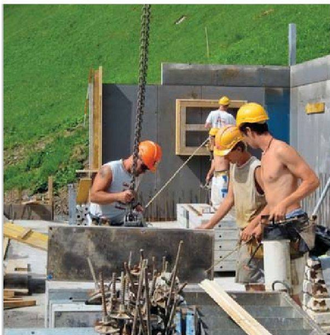
Anpacken für einen guten Zweck: Lernende der Robert Spleiss AG und der Jäggi + Hafter AG erstellen für eine Bergbauernfamilie einen neuen Stall.

Drei ganz besondere Projektwochen gab es diesen Sommer für 19 Lernende der Bauunternehmungen Robert Spleiss AG und Jäggi + Hafter AG. Sie halfen nämlich bei der Erneuerung eines Bergbauernhofs im Urner Schächental tatkräftig mit. Ihre Aufgabe war der Neubau eines Rindviehlaufstalles, der heutigen Tierschutzbestimmungen entspricht. Das Projekt wurde von der Koordinationsstelle für Arbeiten im Berggebiet (KAB) organisiert. Die Lernenden führten die Ortbetonarbeiten, wie Bodenplatten, Brüstungen und Wände schalen, bewehren und betonieren, aus. Jeweils ein Polier der beteiligten Firmen begleitete die Gruppe und unterstützte sie fachlich. Zweck dieses wohlthätigen Projekts war einerseits die Erweiterung des Fachwissens, aber auch die Förderung der Sozialkompetenz.