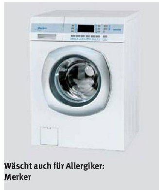
Wäscht auch für Allergiker: Merker