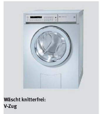
Wäscht knitterfrei: V-Zug