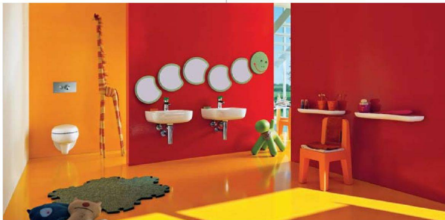
Kinderbad mit Blümchen und Raupen: Keramik Laufen

verstauen lassen, und mit einheitlichen Produktlinien. Beispiele sind die bereits erwähnte Serie «moderna plus», die sich auch mit Naturmaterialien kombinieren lässt, oder «living city» mit geometrisch geformten, schlichten Möbeln. Auf Naturoptik und ökologische Materialien setzt auch Richner mit dem Programm «Atlas Concorde».