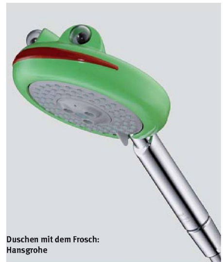
Duschen mit dem Frosch: Hansgrohe