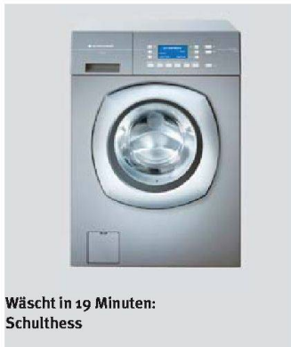
Wäscht in 19 Minuten: Schulthess