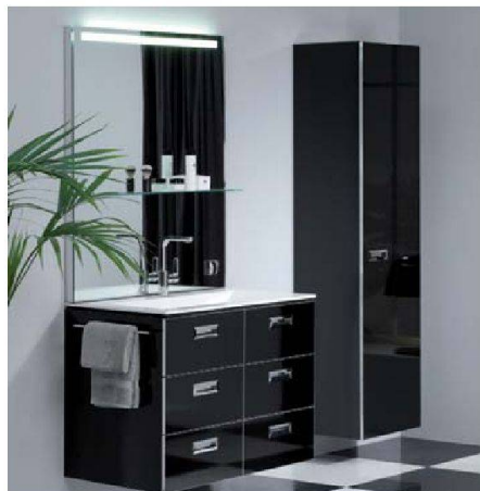
Hochglanz-Schwarz und Chrom: Sanitas Troesch

Reduziertes Design mit geometrischen Formen sieht man in den Badezimmern schon länger. Gleich mehrere Anbieter präsentieren diesen Trend nun in einer neuen, an die Achtzigerjahre erinnernden Optik: mit Schwarz-Weiss-Kontrasten, glänzenden Oberflächen und Chrom. Keramik Laufen etwa hat seine klassische Produktlinie «mo-