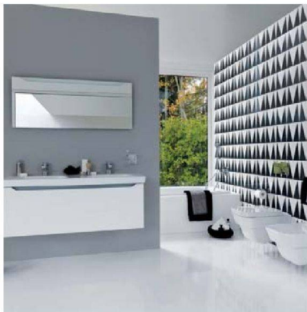
Geometrie im Achtzigerjahre-Look: Keramik Laufen

Ein Augenschein bei den Herstellern zeigt: Mit ihrer Vorliebe für Bäder in Weiss und Naturfarben liegen die Baugenossenschaften eigentlich im Trend. Reduziertes Design ist immer noch in, allerdings in etwas neuer Form: Damit kein weiss gekacheltes Einerlei herrscht, kombinieren die Anbieter Weiss mit Schwarz oder setzen auf Naturmaterialien und asiatische Schlichtheit. Eine Inspiration vielleicht auch für kleine Genossenschaftsbäder?