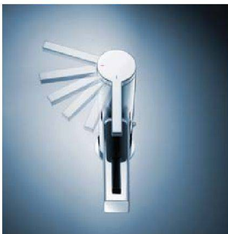
Spart warmes Wasser: Ava Coolfix (Arwa)

sehr flexibel kombinierbar sind auch die Badmöbel des Programms «Twist» von 4B Badmöbel, das gemäss Herstellerin bis zu tausend verschiedene Möglichkeiten erlaubt. Richner bietet mit «Uno» ein preisgünstiges Komplettbad, das speziell für Mietwohnungen konzipiert wurde.