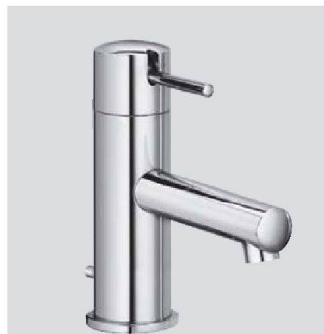
Schlicht und sparsam: Similor