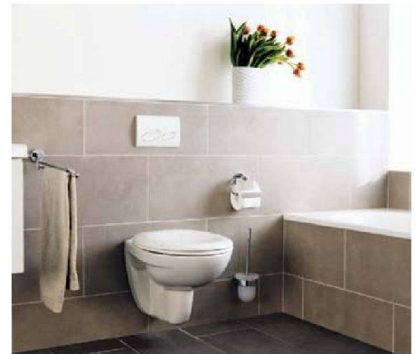
Speziell für Mietwohnungen: Richner