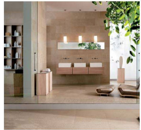
Ökologische Materialien: Richner