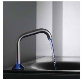
Buntes Wasser von Zauberhand: KWC