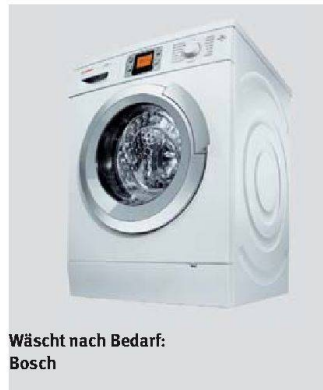
Wäscht nach Bedarf: Bosch