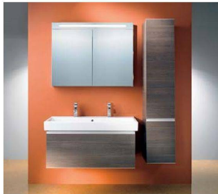
Über 1000 Kombinationsmöglichkeiten: 4B