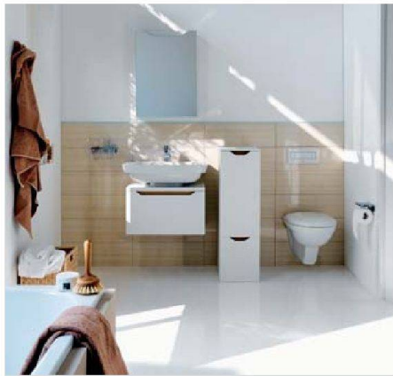
Entspannte Badgestaltung: Laufen (moderna plus)