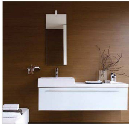
Schlicht und ruhig: Laufen (living city)