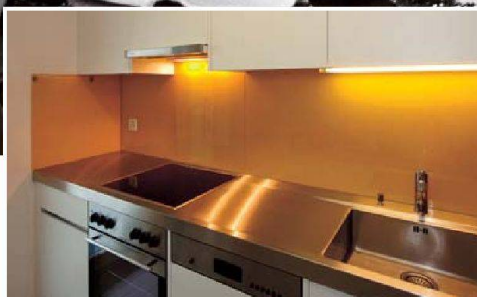
Im Sydefädli 25/27, 8037 Zürich Bauherr: Stiftung PWG, Zürich