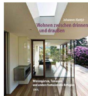
Wohnen zwischen drinnen und draussen

Marc Grollmund, Isabelle Hannebicque Prima Klima mit Pflanzen 128 S., 120 Farbfotos, 22.90 CHF Verlag Eugen Ulmer, Stuttgart 2010 ISBN 978-3-8001-5991-8