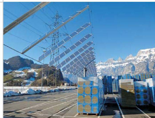
Neuartige Photovoltaikanlage auf dem Flumroc-Werkgelände.