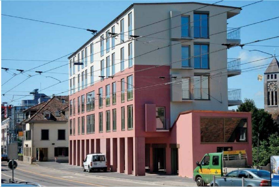
Bei der Farbgebung der beiden Häuser der WSGZ-Überbauung Rigiplatz orientierten sich die Architekten an den vorherrschenden Fassadentönen im Quartier.

WOHN- UND SIEDLUNGSGENOSSENSCHAFT ZÜRICH (WSGZ)