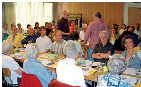
An den Generalversammlungen entscheiden Genossenschaftsmitglieder jeweils über wichtige Vorhaben. Bei der Biwog (Bild) war dies ein Projektierungskredit für einen Neubau.

Zürich, nachdem sie an einer früheren GV bereits den Projektcredit angenommen hatten. □ Die Wogeno Zürich genehmigte den Projektcredit für einen Neubau mit 17 Wohnungen bei der bestehenden Siedlung Bockler in Schwamendingen (vgl. wohnen 6/2010). □ An der Generalversammlung der Baugenossenschaft Zürichsee (BGZ) schliesslich sprachen sich die Mitglieder für den Ersatzneubau Unterfeld 2 aus, der rund zwanzig Wohnungen umfasst.