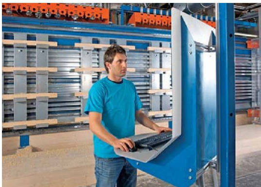
Die Fenster Fabrik Albisrieden setzt platzsparende Holzbearbeitungsmaschinen ein, um auch weiterhin am teuren Standort Zürich produzieren zu können.

Seit Jahren schon verlassen Fabrikationsbetriebe die Stadt. Je weiter weg, desto billiger sei das Land und desto tiefer die Löhne, so wird argumentiert. Trotz dieser scheinbar logischen Argumentation gibt es immer noch Produktionsbetriebe in Zürich. Einer davon ist die Fenster Fabrik Albisrieden AG, kurz FFA. Die Fabrik bedeckt gerade mal 4000 Quadratmeter teures Stadtzürcher Land, und trotzdem ist der Ausstoss an Qualitätsfenstern in Holz- und Holz-Metall-