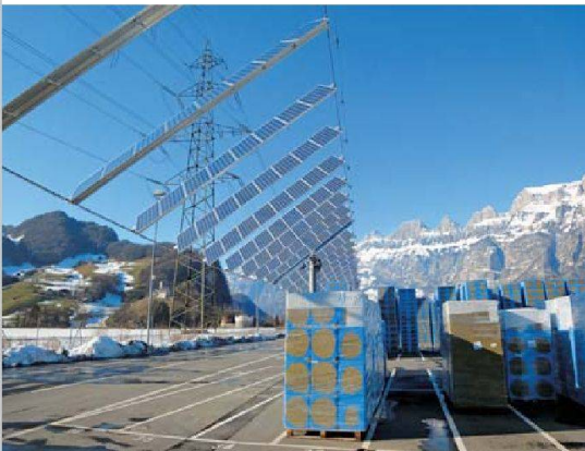
Neuartige Photovoltaikanlage auf dem Flumroc-Werkgelände.

Optisch erinnert die Solar-Wings-Anlage an einen Sessellift. Die Technologie stammt denn auch vom lokalen Seilbahnhersteller Bartholet Maschinenbau. Die derzeit 320 Solarmodule sind beweglich auf zwei Seilen montiert. Sie lassen sich in zwei Richtungen drehen, was eine permanente Nachführung nach dem Stand der Sonne ermöglicht. Eine automatisierte Computersteuerung stellt sicher, dass die Sonnenstrahlen jederzeit rechtwinklig auf die Solarzellen fallen. Die Solar Wings schweben auf acht Metern Höhe. Lastwagen können wie bis anhin ungehindert über das Gelände fahren. Das Ganze kann unter www.flumroc.ch live mitverfolgt werden.