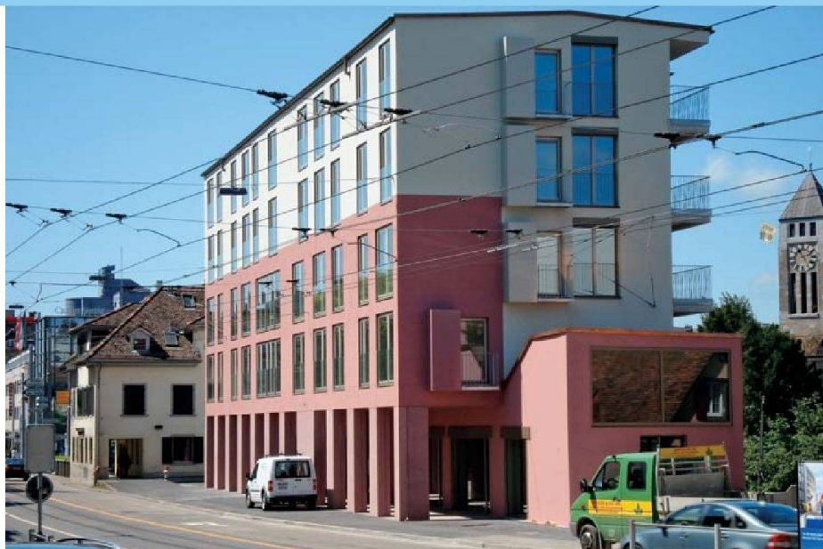
Bei der Farbgebung der beiden Häuser der WSGZ-Überbauung Rigiplatz orientierten sich die Architekten an den vorherrschenden Fassadentönen im Quartier.

WOHN- UND SIEDLUNGSGENOSSENSCHAFT ZÜRICH (WSGZ)