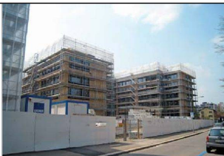
Die Auftragsbücher der Zürcher Baufirmen sind voll, die Preise steigen.

Die Baufirmen begründeten Preisanstiege vor allem mit höheren Lohn-, Material- und Deponiekosten. Die Konjunkturlage ist